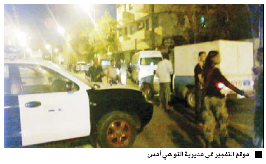
موقع التفجير في مديرية التواهي أمس

□ سنعاء / سيا: وقال المصدر أن هذه العملية الانتحارية تكشف بلاء مدى ما وصلت إليه عناصر التنظيم الإرهابي من يأس وشعور بمرارة الهزيمة بعد الضربات الموجعة التي تلقاها على أيدي أبطال القوات المسلحة والأمن في محافظة أبين وغيرها من المناطق.