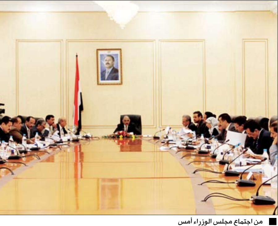
من اجتماع مجلس الوزراء أمس