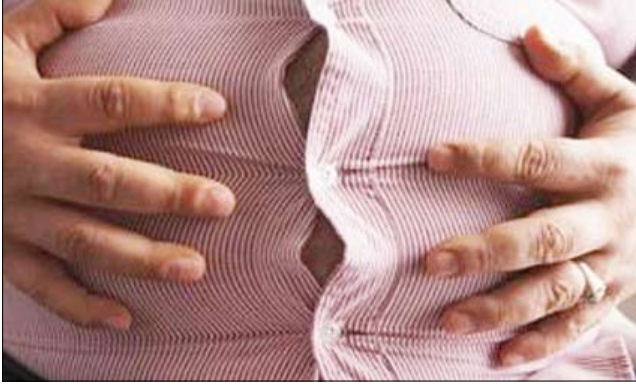
فضلا عن انشغالهن وعدم توفر الوقت الكافي لديهن لممارسة الرياضة. إلى أنهن يتبعن نمطا غذائيا غير صحي وأرجع الخبراء سبب زيادة وزن النساء