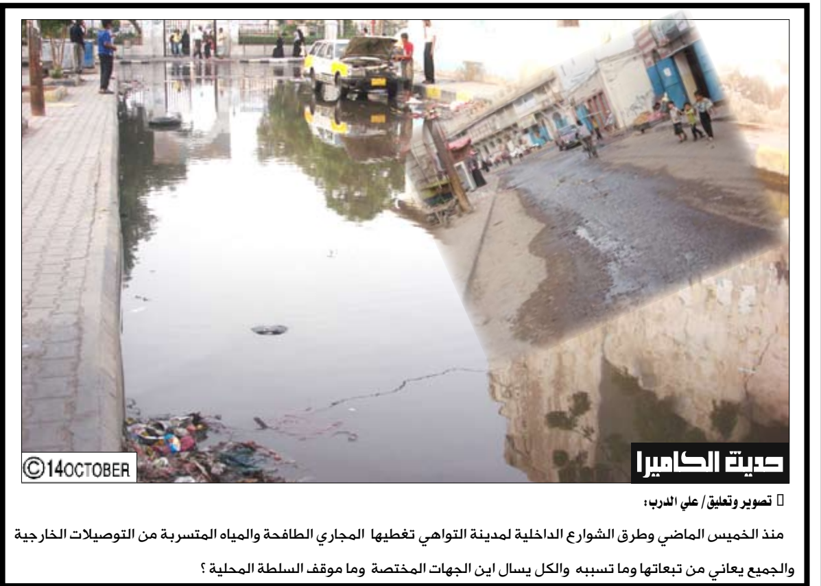
صديت الكاميرا تصوير وتعليق / علي الدرب: منذ الخميس الماضي وطرق الشوارع الداخلية لمدينة التواهي تغطيها المجاري الطافحة والمياه المتسربة من التوصيلات الخارجية والجميع يعاني من تبعاتها وما تسببه والكل يسأل أين الجهات المختصة وما موقف السلطة المحلية؟

شاب كويتي يفهم عليه من أول نظرة للعروس أصيب شاب كويتي باختناق وضيق شديد في التنفس أثناء تقدمه لحطية فتاة، وذلك بعد لحظات من القاء النظرة الشرعية عليها. وذكرت صحيفة «الوطن» الكويتية أن مراسم خطبة بإحدى القرى التابعة لمنطقة «الباحة» انتهت بنقل الشاب «الخطيب» للمستشفى بعد لحظات من النظرة الشرعية، حيث اتضح فيما بعد أن «العروس» أصابته بعين بعد أن سرها منظر الشاب. وتعود تفاصيل القصة إلى أن أحد الشبان تقدم لحطية فتاة من خارج عائلته، وبعد أن تم الاتفاق على تفاصيل الزواج، طلب الشاب الوسيم أن يشاهد الفتاة قبل أن يعقد القران عليها. وبعد أن تم تلبية رغبة الشاب في الحصول على