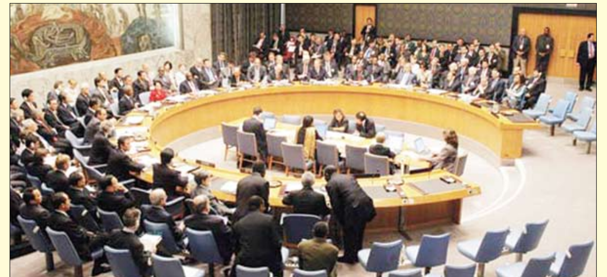
مجلس الأمن / ارشيف

نيويورك / متابعات، استخدمت روسيا والصين حق النقض الفيتو ضد مشروع القرار الأوروبي حول سوريا خلال جلسة عقدتها مجلس الأمن الدولي الليلة قبل الماضية للتصويت على مشروع القرار . وذكرت وكالة الصحافة الفرنسية أن كلا من لبنان والهند وجنوب افريقيا والبرازيل امتنعت عن التصويت على مشروع القرار . وقال المندوب الروسي فيتالي تشوركين في كلمته أمام المجلس إنه من الواضح أن نتيجة التصويت ليست قضية حول قبول الكلمات والصياغة بل هي اختلاف في الأساليب والنظرة السياسية . وأضاف أن (الوقد الروسي منذ البداية قام بجهود كبيرة للتوصل إلى رد فعل إيجابي من المجلس حول الأحداث التي تحصل في سورية وأول هذا الرد ظهر على شكل بيان رئاسي في الثالث من شهر أغسطس وبناء على ذلك الأسلوب نحن مع زملائنا الصينيين حددنا مشروع قرار ووضعنا فيه مع تطور الأحداث بعض التغييرات وأخذنا