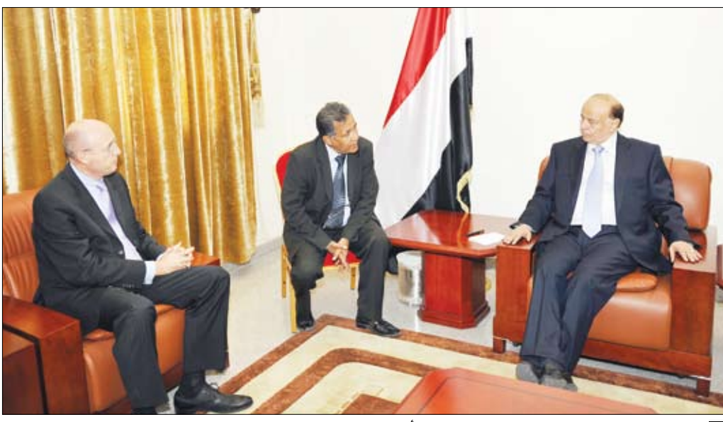
نائب الرئيس لدى استقباله السفير الفرنسي أمس

صفا / سيا، استقبل الأخ عبدربه منصور هادي نائب رئيس الجمهورية أمس سفير جمهورية فرنسا الصديقة جوزيف سلفا بمناسبة انتهاء فترة عمله . وجرى خلال اللقاء بحث القضايا والموضوعات المتصلة بالعلاقات المتينة بين البلدين . ووصف الأخ نائب رئيس الجمهورية تلك العلاقات بالمتينة والتاريخية والمتطورة .. مشيراً إلى أن الشركات الفرنسية في اليمن تعمل بصورة ناجحة وممتازة وفي مقدمتها شركة توتال لاستخراج وإنتاج النفط والغاز . وقال :«التنسيق بين الحكومتين اليمنية والفرنسية جيد فيما يتعلق بمكافحة الإرهاب والقراصنة في خليج عدن والساحل الصومالي ..» لافتاً إلى أهمية التعاون الدولي لتأمين الملاحة في هذا الممر الحيوي . وأشار الأخ عبدربه منصور هادي إلى أن حوالي ثلاثة ملايين برميل نفط تمر من باب المندب يومياً إلى أوروبا والعالم .. مؤكداً أن لفرنسا وجوداً على الضفة الأخرى من خليج عدن في جيبوتي والقرن الإفريقي ولديها خبرات كثيرة في المنطقة . وتطرق نائب رئيس الجمهورية إلى المواجهة التي يخوضها أبطال القوات المسلحة ضد الإرهاب خصوصاً بمحاضرة أبين التي تجمع إليها شرادم تنظيم القاعدة من كل المحافظات اليمنية وكذلك من بعض