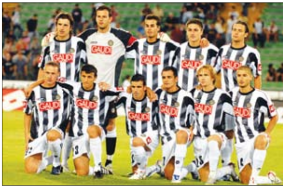
□ روما / سايغات:

استعاد أودينيزي نغمة الانتصارات التي غابت عنه في الأسبوعين الأخيرين وذلك من خلال فوزه على ضيفه الجريح بولونيا 2 - صفر على ملعب "فريولي" في المرحلة السادسة من الدوري الإيطالي لكرة القدم يوم أمس.