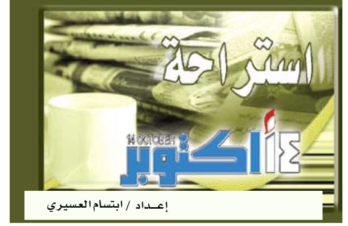
إعداد / ابتسام العسيري

تندن / متابعات : نجح علماء الفلك في المرصد الأوروبي «إي اس أو» في تصوير الضباب الذي يحيط بنجم «بيضة المرأة» والذي يقع في كوكبة العقرب في قلب درب التبانة. وأشار المرصد في مدينة جارشينج جنوب ألمانيا، إلى أن ظاهرة هذا الضباب شديدة الندرة في الكون وأن النجم المشار إليه أحد النجوم التي تعرف بالعملاق الأصفر الذي يزيد قطره نحو ألف مرة عن قطر الشمس ويمتلك كتلة أكبر 20 مرة من كتلة الشمس ويضيء أكثر منها بـ 500 ألف مرة ويحاط بضباب من الغاز والغبار جعل هذا النجم يبدو من بعيد وكأنه بيضة وسط مرآة. وكشف هذا الجرم السماوي عام 1983 وهو أحد أكثر 30 نجماً إضاءة في سماء الأشعة تحت الحمراء.