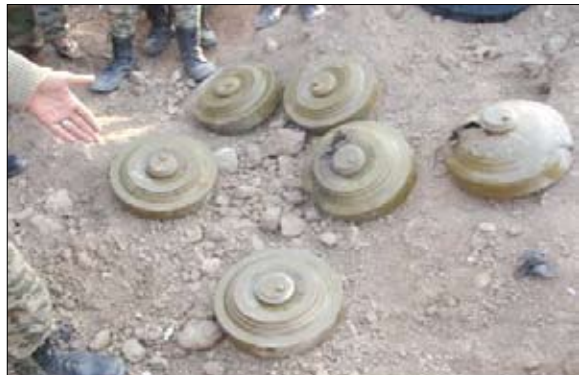
تتمتس في قوات الفرقة في شارع الزبيري جوار حلويات

أبو خالد والذي قامت بتلغيمة قبل انسحابها منه، وقد أدى انفجار أحد هذه الألغام التي وقعت في طريق طفله إلى بتر يد الطفل وساقه وعند إسعافه إلى المستشفى توفي هناك متأثراً بإصابته.