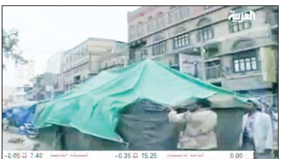
صورة فنان من الفرقة المتمردة وهو يصطاد ضحايا من خلف أحد مخيمات المتصممين في شارع الزراعة

شاهد على موقع صحيفة (14 أكتوبر) الفيديو الذي يتضمن لقطات لعصر من فرق القناصة التي أعدها المنشق علي محسن الأحمر لقتل المتظاهرين حيث كان ذلك القناص يطلق النار عليهم من الخلف خلال مسيرة 18 سبتمبر 2011 م بصنعاء .. وهو ما يفضح زيف ادعاءات الانقلابيين والمخربين .. ومعهم بعض القوات الفضائية التي جندت نفسها لشن حرب إعلامية مضللة وظالمة ضد اليمن ووحده وأمنه واستقراره .. وانتظروا المزيد . لمشاهدة الفيديو : www.14october.com