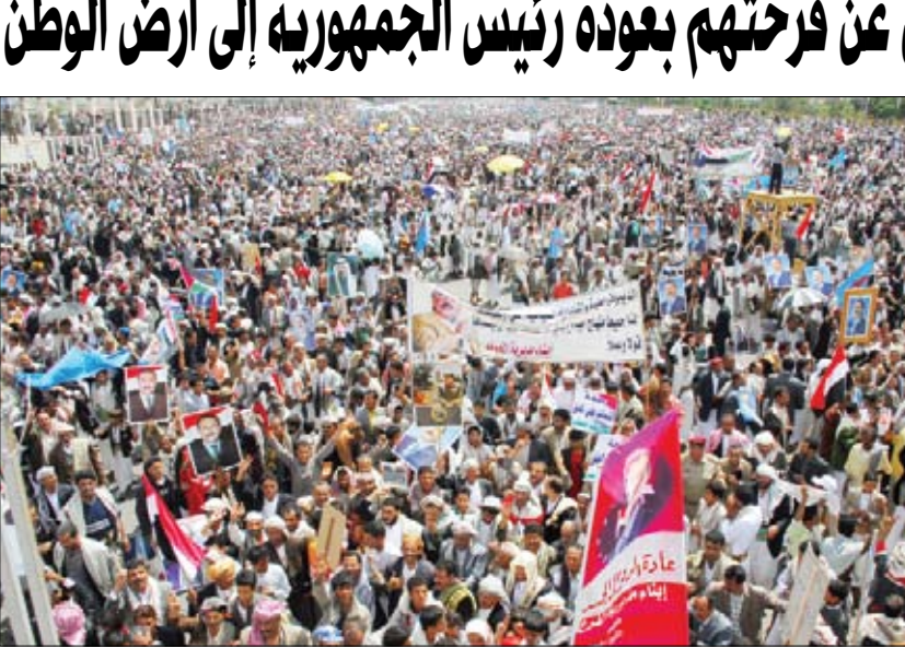
ملايين اليمنيين يعبرون عن فرحتهم بعودة رئيس الجمهورية أمس

صنعاء / سيأ: والمديريات توجه ملايين المواطنين في مسيرات ومهرجانات جماهيرية حاشدة لتأكيد مواقفهم الثابتة والمتمسكة بالنظام والقانون والرافضة لأعمال التخريب والفضوى والتعبير عن الوفاء للوطن والثورة والوحدة والتعبير عن الحب العميق لليمن والشعب والدولة ونظامنا الديمقراطي القائم على الشرعية الدستورية التي تعد صمام أمان كل المكاسب الديمقراطية والتنموية.