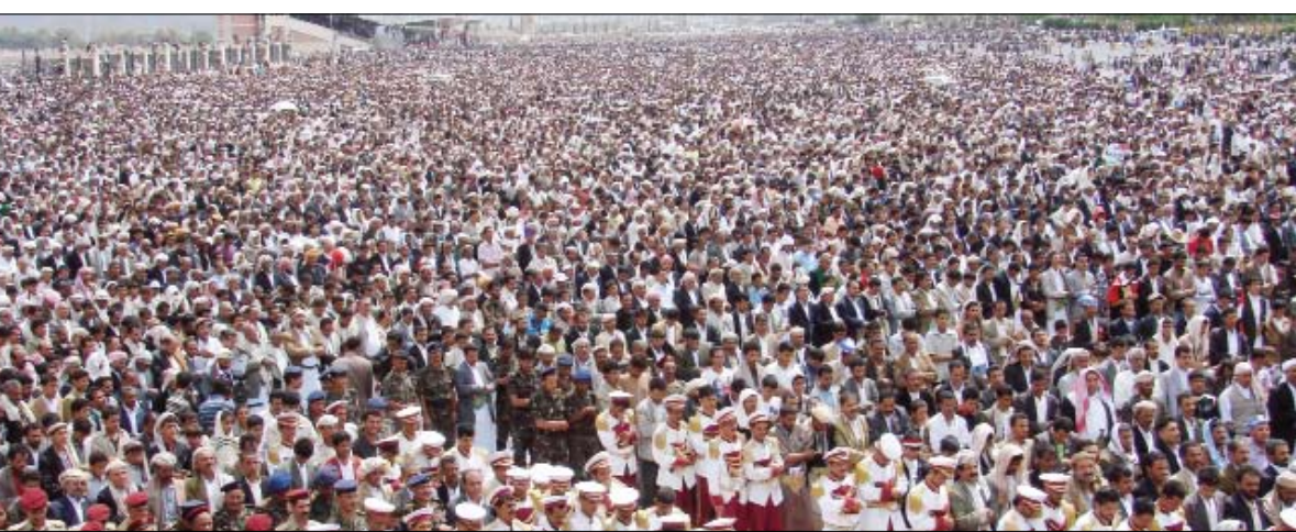
جانب من صلاة «جمعة الثبات على الحق ونصرة الشعب الفلسطيني» أمس

صنعاء / سيأ: أضاف: «لقد عاد رئيس الجمهورية إلى أرض الوطن صباح يومنا هذا (أمس) الجمعة بحمد الله وسلامته، عاد قلب اليمن النابض وشران الحياة في جديد ليقول للأعداء والمنافقين والشامتين والحاسدين والطامعين هانئاً أتبعه بالحق والعافية من الله سبحانه، لقد أبقاني الله للشعب بعد ما أردتم سلب الحياة عني، أردتم لي الموت فأراد الله لي الحياة، أردتم لي الموت فأراد لي الله البقاء، فأعتبروا يا أولي الألبان، اعتبروا يا مكابرون». ومضى قائلاً: «ليسمع العالم أجمع إن الشعب اليمني يحب رئيسه وقائده وسبب خلفه خلف قائده صفاً واحداً وقلباً واحداً مع الشرعية الدستورية وتدعونا هذه المناسبة للاحتفال بعودة الفارس إلى أرضه ووطنه، فقد كسر كل الرهانات والمكاييد وكل الادعاءات والتبؤات السياسية الماكرة والحاقد المشوهة لكل إنسان وطني».