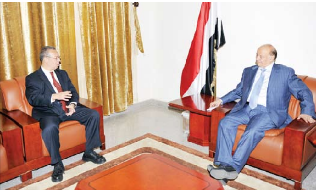
نائب الرئيس لدى لقائه المستشار السياسي للأمين العام للأمم المتحدة أمس

صباح / سيا، استقبل الأخ عبد ربه منصور هادي نائب رئيس الجمهورية أمس المستشار السياسي للأمين العام للأمم المتحدة جمال بن عمر الذي يزور صنعاء حالياً للاطلاع على مجريات الأحداث الأخيرة والتصعيد الذي أدى إلى الانفجار العسكري. وقد رحب الأخ نائب رئيس الجمهورية بالمستشار السياسي للأمين العام، متناولاً طبيعة المستجدات التي أدت إلى تلك التطورات المزعجة.. مشيراً إلى أنه كان يتم الاهتمام في البحث عن المخرج السلمية والأمنة من الأزمة الراهنة التي أتت على الأخضر واليابس وأصبح الصغير والكبير يعاني من ويلاتها. ولفت إلى أن أكثر من ثمانين بالمائة من الشعب اليمني يتجرع ويلات هذه الأزمة وليس له دخل بمجرياتهما أو مسارها أو طبيعة منشئها بل هو بحاجة ماسة للعمل وتوفير لقمة العيش الكريم إلا أن الخلافات العاصفة بين القوى السياسية بكل جوانبها تعطل تلك الحياة المنشودة. وأشار الأخ نائب رئيس الجمهورية إلى أن الجهود الدولية تنصب جميعها في سبيل البحث عن مخرج من الأزمة السياسية كون اليمن يعاني اليوم من أزمات مستفحلة على مختلف الصعد الأمنية والسياسية والاقتصادية ولا بد من الخروج من هذا النفق بالطرق السلمية ووفقاً للتفويض الكامل من فخامة رئيس الجمهورية بالتفاوض على تزمين وتنفيذ المبادرة الخليجية كونها الطريق الوحيد