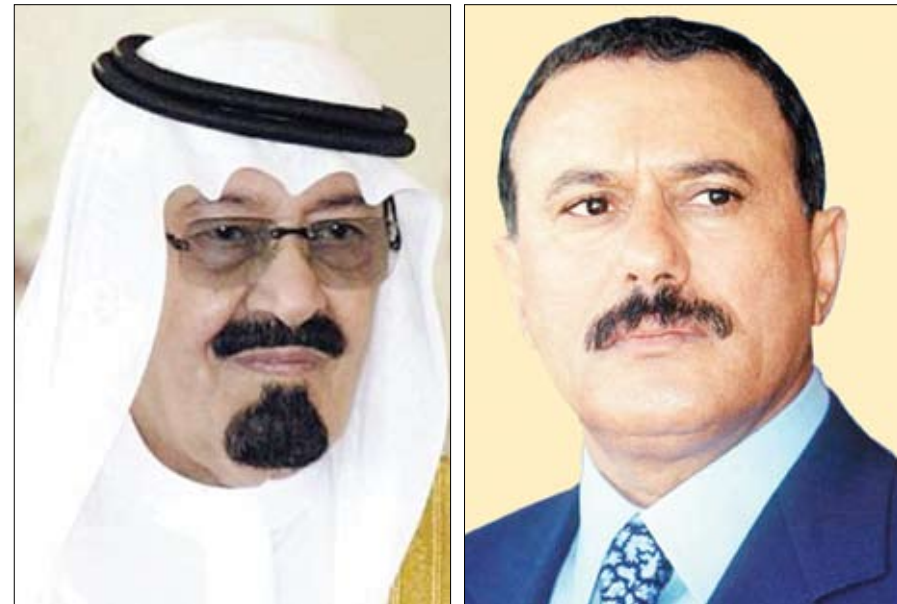
بعث فخامة الأخ الرئيس علي عبد الله صالح رئيس الجمهورية برقية تهنئة لأخيه خادم الحرمين الشريفين الملك عبد الله بن عبد العزيز آل سعود ملك المملكة العربية السعودية بمناسبة احتفالات شعب المملكة الشقيق بالعيد الوطني.