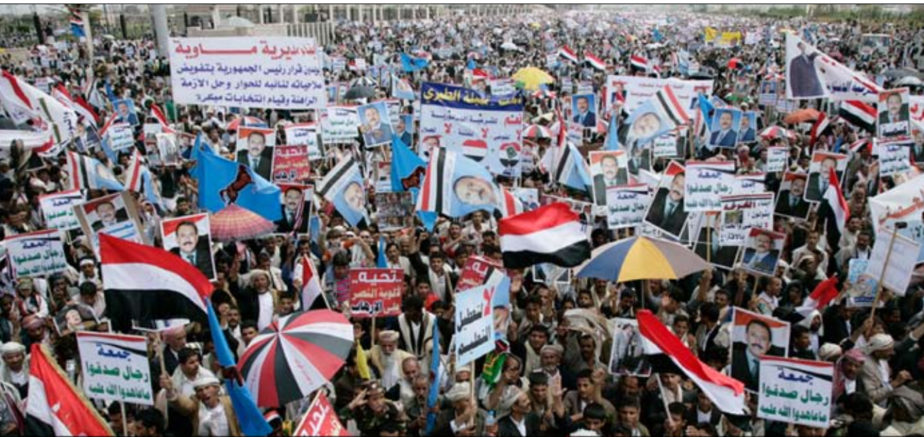
ملايين اليمنيين في جمعة (رجال صدقوا ما عاهدوا الله عليه) أمس

صنعا / سبأ : ونددت الحشود الملايينية بتلك المواقف الخائنة المعادية للشعب والوطن وللأمن والاستقرار من ناكثي العهود والمارقين على القيم الدينية والوطنية والمثل الأخلاقية.. معبرين عن الاعتزاز والتقدير لكل أبناء الوطن الملتزمين بأداء الواجبات الدينية والمسؤوليات الوطنية في كل الأحوال والظروف والتأثيرين على عهدهم وولائهم والصامدين في مواقع البذل والتضحية والفداء لتبقى راية الشرعية الدستورية مرفرفة في كل ربوع الوطن اليمني رغم كل أعمال التآمر والعدوان. ورفع المشاركون في المهرجانات والمسيرات لافتات وشعارات عكست مدى جهم واعتزازهم بوطنهم الغالي اليمن الذي سيظل شامخا برجاله الصادقين الأوفياء لوطنهم في السراء والضراء وفي السر والعلن.. مؤكداً حرصهم على خدمة الوطن الذي يحتاج اليوم إلى رص الصفوف أكثر من أي وقت مضى.