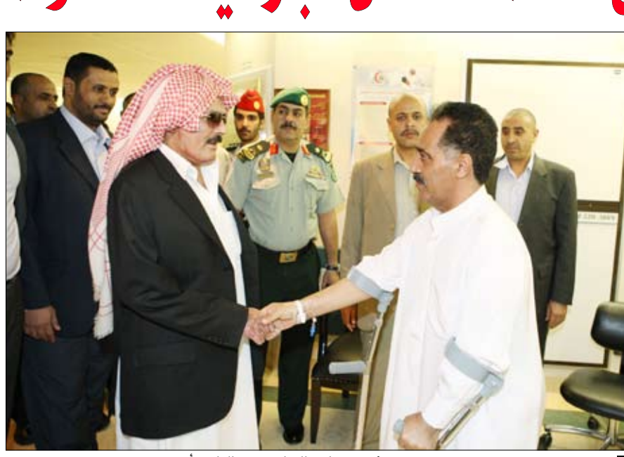
رئيس الجمهورية يطمئن على صحة رئيس مجلس النواب يحيى الراعي أمس

صنعا / سبأ : وقد جدد فخامة الأخ رئيس الجمهورية الشكر والامتنان لأخيه خادم الحرمين الشريفين الملك عبدالله بن عبدالعزيز وولي عهده وقيادة وحكومة المملكة والشعب السعودي الشقيق على الرعاية والعتاية اللتين يلقاهما الأخوة المسؤولون مدنيين وعسكريين في مستشفيات المملكة والذين أصيبوا في الحادث الإرهابي الغادر على جامع دار الرئاسة .