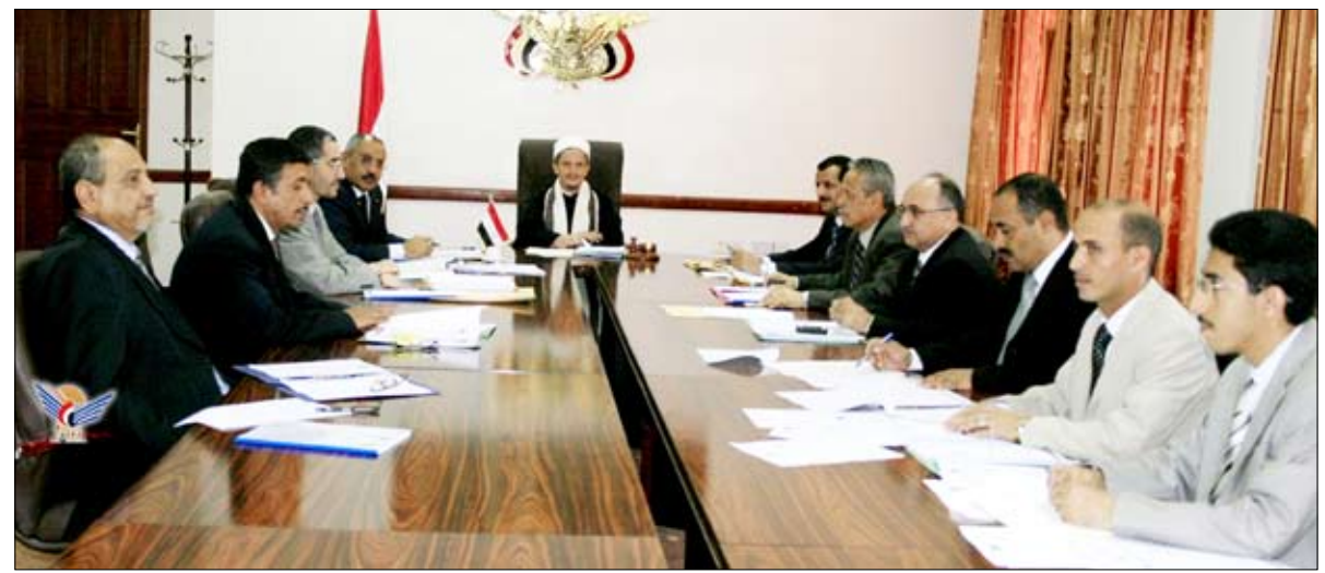
مجلس القضاء الأعلى في اجتماعه أمس

صنعاء / سيا: وافق مجلس القضاء الأعلى في اجتماعه أمس برئاسة رئيس المجلس رئيس المحكمة العليا القاضي عصام السماوي، على إقرار تنقلات 43 من قضاة المحاكم الابتدائية، وذلك بناء على الترشيحات المقدمة من وزير العدل. وناقش المجلس مذكرة وزير العدل المتضمنة طلب الموافقة على انتداب ثلاثة من القضاة ذوي الخبرة والكفاءة بهيئة التفتيش القضائي ووافق على ذلك بهدف تمكين هيئة التفتيش من زيادة فاعليتها في الرقابة والتفتيش على تسمية عضوين من أعضاء المحكمة العليا وقمض البلاغات والشكاوى المرفوعة من المواطنين والمحامين رشيد هويدي