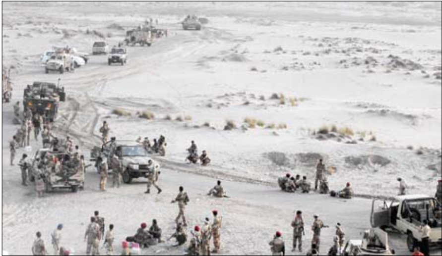
وحدات من الجيش خلال دخوله زنجبار

الطاهري وقائد المنطقة العسكرية الجنوبية اللواء الركن مهدي موهدي قائد معسكراً من محافظة أبين قدرها 30 مليون دولار أمريكي، وذلك في إطار التعاون الثنائي بين البلدين الصديقين في كافة المجالات، والتنسيق المشترك الجاري حالياً بين الجانبين لاستئناف العمل في المشاريع التنموية في الجمهورية اليمنية والممولة من جمهورية الصين الشعبية.