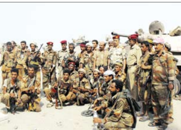
عدد من أفراد القوات المسلحة في أبين

وأكد المصدر أن ما اجرته أبطال القوات المسلحة والأمن ومعهم المواطنين الشرفاء من انتصارات أفضت لمخاطبة الإرهابيين