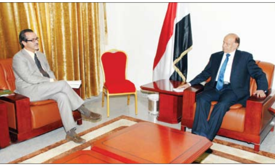
.. ولدى استقباله رئيس بعثة اللجنة الدولية للصليب الأحمر أمس

الجمهورية على إتاحة هذا اللقاء.. مؤكداً أن الواجبات الإنسانية تحتم على البعثة العمل بكل جدية وإخلاص.. متمنياً لليمن الخروج من هذا الظرف الراهن سليمة وأمنة.