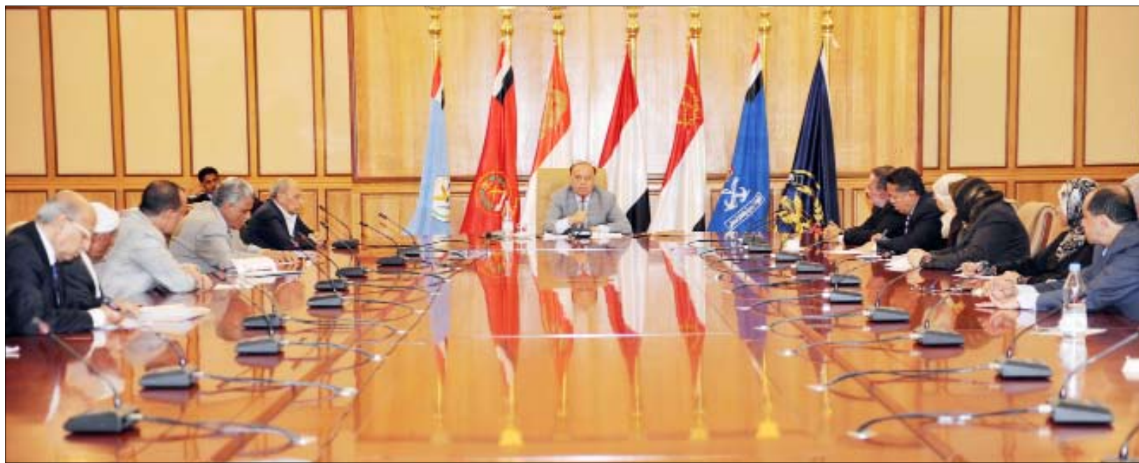
نائب الرئيس يرأس اجتماع اللجنة العامة للمؤتمر الشعبي العام أمس

ومسمياتها المختلفة، وما يجب القيام به انطلاقاً من تفويض فخامة الرئيس علي عبد الله صالح رئيس الجمهورية ووفقاً لما تضمنته المبادرة الخليجية والعمل على وضع الآلية التنفيذية للخروج الآمن من هذه الأزمة وتغليب مصلحة الوطن فوق الاعتبارات. وقد اطلع الأخ نائب رئيس الجمهورية أعضاء اللجنة العامة على التفاصيل المتعلقة بذلك، وموقف دول مجلس التعاون الخليجي والاتحاد الأوروبي والولايات المتحدة الأمريكية. وشدد الأخ عبد ربه منصور هادي نائب رئيس الجمهورية - النائب الأول لرئيس المؤتمر الأمين العام على ضرورة استشعار المسؤولية الوطنية التاريخية الجسيمة التي يجب أن يضطلع بها الجميع. وقال إن الوطن اليوم يعيش محنة حقيقية طالت الجميع دون استثناء وباتت تروق الكبير والصغير. وأشار إلى أن التصعيد الأخير أخذ يزيد الأزمة اشتعالاً وخطورة. وستواصل اللجنة اجتماعها اليوم الأربعاء في إطار جدول أعمالها.