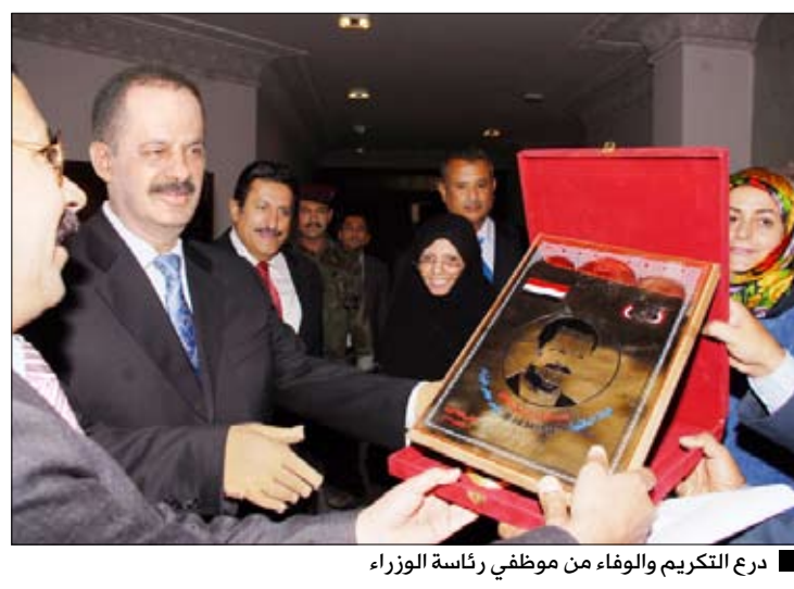
درع التكريم والوفاء من موظفي رئاسة الوزراء

نظمت الأمانة العامة لمجلس الوزراء أمس حفل استقبال وتكريم لدولة الدكتور علي محمد مجور رئيس مجلس الوزراء بمناسبة تمانئه للشفاء وعودته الحميدة لممارسة مهامه وأعماله. وعبر المستقبِلون من قيادات وعموم موظفي رئاسة الوزراء عن فرحتهم الغامرة وسعادتهم الكبيرة بعودة رئيس الوزراء لممارسة مهامه بعد تمانئه للشفاء من الاعتداء الإجرامي الغادر الذي استهدف فخامة الرئيس علي عبدالله صالح رئيس الجمهورية وكبار قيادة الدولة أثناء أدائهم الصلاة في مسجد النهديين بدار الرئاسة في أول جمعة من رجب الحرام.. وهنؤوا رئيس مجلس الوزراء بسلامة العودة وبعيد الفطر المبارك. وطالبوا بسرعة كشف نتائج التحقيقات الجارية لمعرفة ملامسات هذه الحادثة الإجرامية وسرعة ضبط وتقديم كل من ارتكب هذا العمل الغادر وخطط له إلى العدالة لينالوا جزاءهم الرادع جراء ما اقترفوه من جريمة شنعاء لا يقرها دين أو شرع أو عرف. وقد عبر رئيس مجلس الوزراء عن امتنانه وشكره لهذه المشاعر الطيبة التي عبر عنها موظفو وقيادات المجلس. وتبادل معهم التهاني والتبريكات بمناسبة عيد الفطر المبارك.