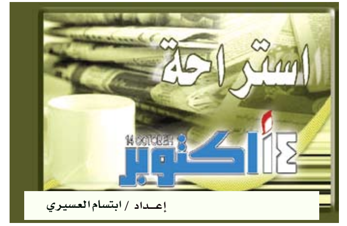
إعداد / ابتسام العسيري

تورونتو / مانيات : وجدت دراسة كندية جديدة أن المستن الذين يتناولون الأغذية الغنية بالملح ولا يمارسون الرياضة يعانون بشكل أسرع من تراجع في صحتهم العقلية ويزيد خطر إصابتهم بالخرف. وذكرت صحيفة «تورونتو صن» الكندية أن الباحثين في «مستشفى بايكسر» وجدوا دليلاً على أن الأغذية التي تحتوي على كميات عالية من الملح، مع قلة النشاط الجسدي، يمكن