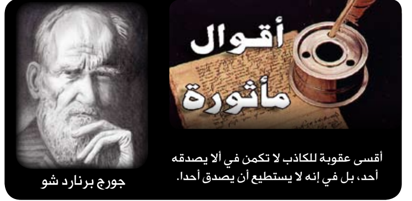
جورج برنارد شو