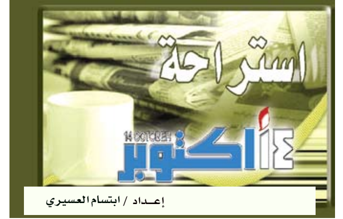
إعداد / ابتسام العسيري

ومن المعروف للجميع أن للرياضة تأثيرا إيجابيا على صحة الإنسان ولكن لم يكن العلماء يعرفون ما إذا كانت ممارسة الرياضة أقل من 150 دقيقة أسبوعيا حسبما يوصي العلماء يمكن أن تكون لها آثار إيجابية على صحة الفرد . وجاء في تعليق على الدراسة في المجلة نفسها أن "معرفة أن التحرك 15 دقيقة يوميا يمكن أن يخفض نسبة الوفاة بشكل جوهري يشجع الناس على القيام بالمزيد من الحركة في يومهم المزدحم .". ودعا معدو الدراسة الحكومات وقطاعات الصحة في دول العالم إلى نشر "هذا الخبر السعيد" وإقناع الناس بممارسة حد أدنى من النشاط الجسدي على الأقل .