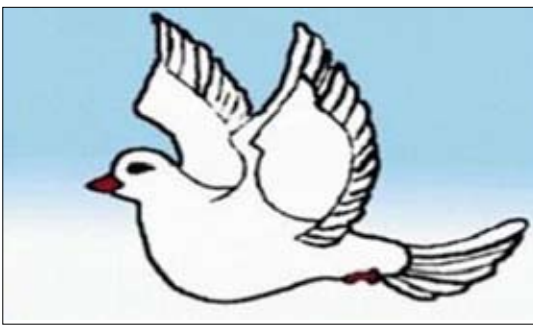
شعار الجهة الوطنية الديمقراطية

نائب رئيس الجمهورية وما يبدية من حرص على الحوار والهدنة ورأب الصدع بين أطراف العمل السياسي، متمنياً أن تكلل جهوده بالنجاح لما فيه خدمة مصلحة الشعب والوطن. وحيث الأمانة العامة للجهة الوطنية الديمقراطية المواقف البطولية والشجاعة والمسئولة للقوات المسلحة والأمن في مواجهة تداعيات الأزمة السياسية ومحاربة الإرهاب وخاصة تنظيم القاعدة في محافظة أبين وغيرها، داعياً كل المواطنين في هذه الظروف الصعبة إلى الوقوف صفاً وواحد إلى جانب هذه المؤسسات الوطنية الكبرى نظراً للأهمية البالغة لدورها الوطني في هذه المرحلة وباعتبار أن الوطن ملك كل أبنائه ويتحتم عليهم القيام بواجبهم نحوه بما يصون مصلحته ويحنيه أي النزلاق نحو الفتن والقوضى. كما أشادت بمواقف وأداء قيادة وزارة الداخلية وأجهزتها المختلفة في تعاملها الحضاري والمسئول مع الأزمة السياسية وحفاظها على الأمن والاستقرار وسلامة المتظاهرين والمعتصمين.