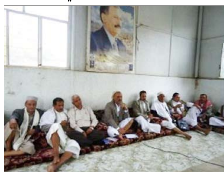
الاجتماع التنظيمي الموسع بمقر فرع المؤتمر الشعبي العام بتعز