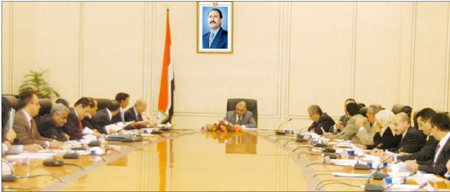
مجلس الوزراء في اجتماعه الأسبوعي أمس