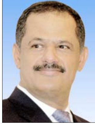
د. علي محمد مجور

قالت مصادر مطلعة إن الأطباء بالمستشفى العسكري في الرياض سمحوا للدكتور علي محمد مجور رئيس مجلس الوزراء بمغادرة المستشفى بعد أن تحسنت حالته الصحية جراء إصابته في الحادث الإرهابي الغادر الذي استهدف فخامة رئيس الجمهورية وكبار قادة الدولة وهم يؤدون صلاة أول جمعة من شهر رجب الحرام بمسجد التهدين بدار الأبطال وأكد المصادر أن الأطباء سمحوا للدكتور مجور بالخروج من المستشفى للنقاهة على أن يراجع المستشفى بين الحين والآخر للمتابعة وإجراء بعض الفحوصات الروتينية، وأن بقية المسؤولين الذين أصيبوا في ذلك الاعتداء الإرهابي يتمثلون للشفاء بحمد وفضل من الله.