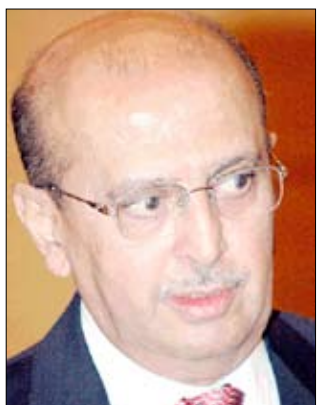
د. ابوبكر القربي

واستبعد وزير الخارجية الحل العسكري لهذه الأزمة.. وقال إن الحل العسكري لن يخرج أحد منه منتصراً والذين يعتقدون أن الحل لهذه الأزمة غير سياسي فهم مخطئون. وأضاف إن الحل العسكري سيؤدي إلى ما رده الكثيرون (حرب أهلية) لأن المجتمع منقسم نصفيين ومنقسم قبلياً عسكرياً سياسياً في إطار الحزب الواحد. وأكد وزير الخارجية أن فخامة الأخ الرئيس علي عبدالله صالح رئيس الجمهورية لن يتنحى إلا عبر صناديق الاقتراع، قائلًا "عندما أقول إن الرئيس لن يتنحى إلا عبر صناديق الاقتراع فهو تأكيد للبدأ الديمقراطي، وأن الخيار أمامنا هو أن نذهب إلى صندوق الاقتراع.. وقال "إذا قبلت يوم أن يخرج نصف الشعب لكي يغيروا النظام معنى هذا أنه بعد ستة أشهر ممكن