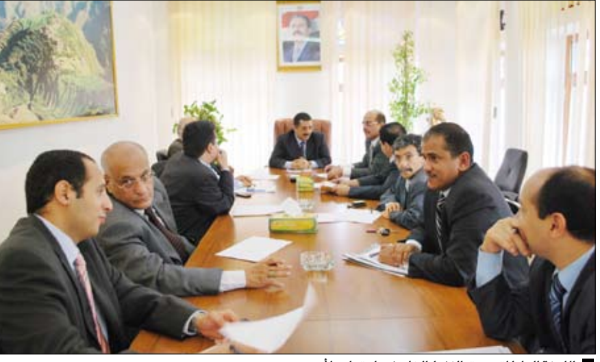
اللجنة العليا لتسويق النفط الخام في اجتماعها أمس

أقرت اللجنة العليا لتسويق النفط الخام في اجتماعها أمس برئاسة وزير المالية نعمان طاهر الصهبي مبيعات النفط الخام لدورة أكتوبر 2011م، وذلك بكمية إجمالية خمسة ملايين برميل. وأقرت اللجنة بيع إجمالي الكمية المتاحة من خام المسيلة المقدر بثلاثة ملايين برميل بسعر برنت المؤرخ ناقصاً 93 سنتاً للبرميل وذلك بحسب أفضل العروض المقدمة من قبل الشركات المتنافسة على الشراء والمقدم من شركة أراكاديا ولكامل الكمية. كما أقرت اللجنة بيع الكمية المتاحة لنفط مارب لشهر أكتوبر والمقدرة بمليون برميل بسعر برنت المؤرخ فلات (أون خصم سعري) لشركة مصافي عدن وذلك بموجب قرار اللجنة العليا بتحديد السعر الرسمي لهذا النفط وقرار مجلس الوزراء بتخصيص هذا النفط لمتطلبات السوق المحلية من المشتقات النفطية. وفيما يتعلق بالكميات المتوقعة لدورة أغسطس من خام مارب المقدر بمليونين و700 ألف برميل وذلك في ضوء استئناف ضخ إنتاج نفط مارب بعد إصلاح الأنابيب وكذا الكميات المتوقعة لدورة سبتمبر والمقدرة بمليون و900