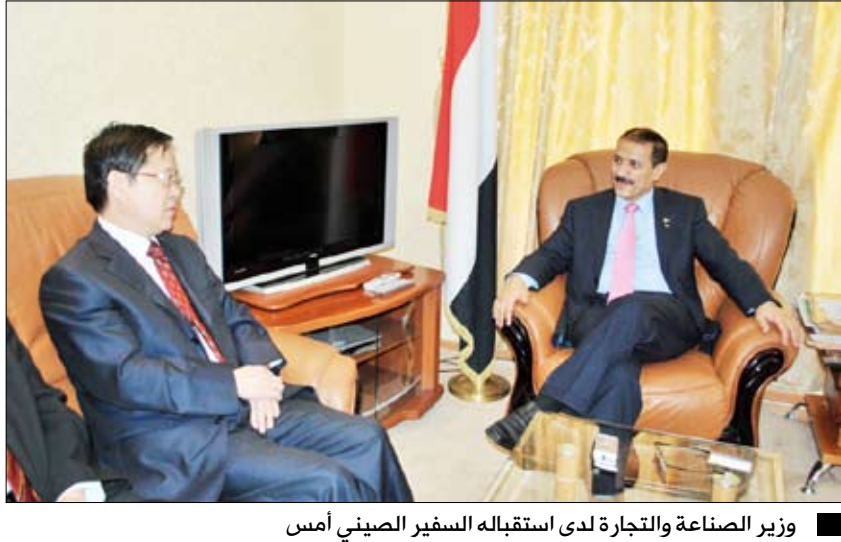
وزير الصناعة والتجارة لدى استقباله السفير الصيني أمس

من جانبه عبر السفير الصيني عن ارتياحه لوضع السوق اليمنية من حيث البدء بتوفير المشتقات النفطية والمواد التموينية التي من شأنها العمل على استقرار السوق وتوفير الاحتياجات اللازمة للمواطنين.