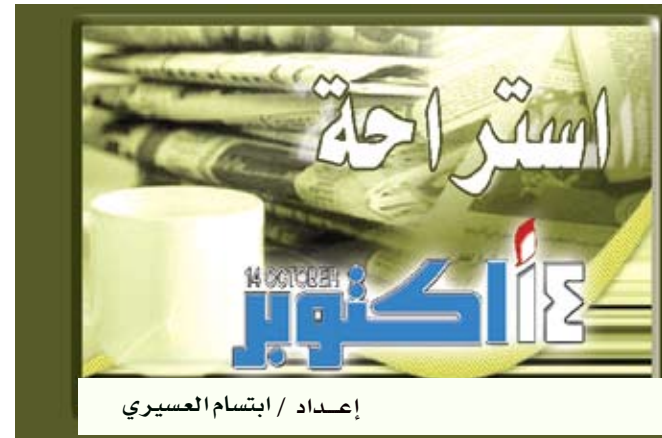
إعداد / ابتسام العسيري

واشنطن/مسابعات: وجد باحثون أميركيون أن التراجع في دقة الساعة الدماغية المرتبط بالتقدم في السن قد يكون السبب وراء صعوبة النوم والتكيف مع التغييرات في الوقت لدى المسنين. وقال الباحثون بجامعة «كاليفورنيا» في لوس أنجلوس إن دراستهم للساعة الدماغية المعروفة بنواة التأقلم، تظهر نمطاً مهماً بالنشاط الإيقاعي الذي يبدأ بالتراجع في