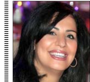
الشاعرة دلال جويدة