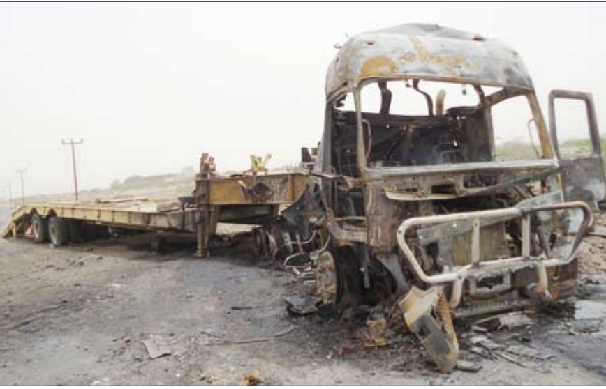
حطام السيارة المفخخة

الإرهابي نفذه أحد عناصر الإرهاب والتطرف من تنظيم القاعدة بسيارة مفخخة من نوع هيلوكس غمارة، حيث هاجم الرتل العسكري خارج