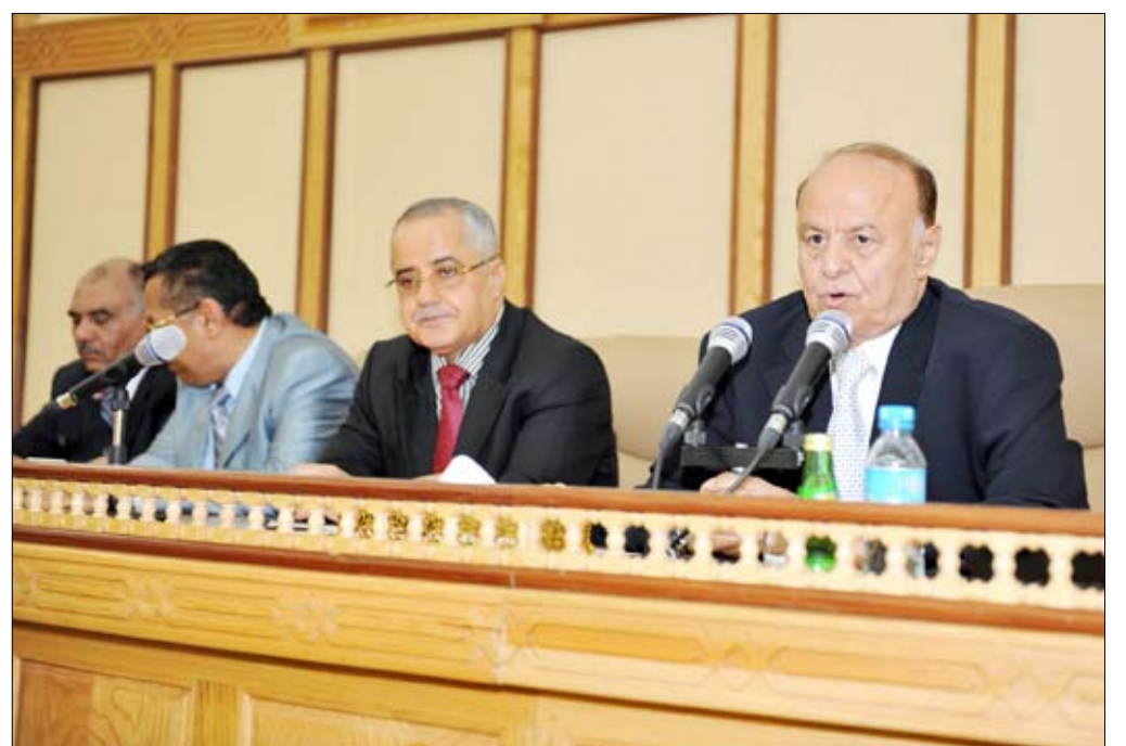
نائب الرئيس خلال ترؤسه الاجتماع الموسع أمس

صنعاء / سبأ، رأس الأخ عبدربه منصور هادي نائب رئيس الجمهورية النائب الأول لرئيس المؤتمر الشعبي العام الأمين العام أمس اجتماعاً موسعاً للجنة العامة والحكومة والهيئة البرلمانية للمؤتمر الشعبي العام والأمانة العامة للمؤتمر. وقد استهل نائب رئيس الجمهورية الاجتماع بكلمة شاملة استعرض فيها تطورات الأوضاع ومجريات الأمور السياسية والاقتصادية والأمنية خلال الفترة الماضية وخاصة بعد الاعتداء الإرهابي الإجرامي الغادر على مسجد التهدين بدار الرئاسة الذي استهدف فخامة الأخ رئيس الجمهورية وكبار مسؤولي الدولة في الجمعة الأولى من شهر رجب الحرام. وقال الأخ نائب رئيس الجمهورية «كلنا مطلعون على ما يدور وتتابع الأحداث أولاً بأول وهناك معلومات متدفقة عما يجري في كل الوسائل الإعلامية بعضها صحيحة وبعضها مختلفة ومسيئة لا يلبث أن يفنض أمرها ولكن مع ذلك هناك نجاحات نتحقق كل يوم وإنجازات كبيرة بفضل تعاون جميع أبناء الوطن الشرفاء الأوفياء وكافة المسؤولين في السلطات التنفيذية الحكومية والسلطات المحلية وقيادات وأعضاء المؤتمر الشعبي العام وحلفائه في كل مكان». وأضاف الأخ عبدربه منصور هادي نائب رئيس الجمهورية بعد أن استعرض لقاءاته مع أطراف المعارضة والمؤتمريين الدوليين والسفراء من الدول الخمس الدائمة العضوية «إن شاء الله هذا الأسبوع قد نتوصل إلى خارطة طريق لحل كافة المشاكل أولاً بأول والأهم قبل المهم وبصورة جدية ومخلصة لا تقبل المواربة».