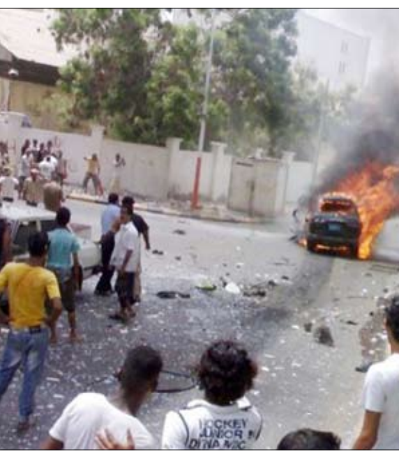
سيارة الخبير الأجنبي بعد انفجارها بعبوة ناسفة ظهر أمس

عدن / سالم العسكري : لقي خبير أجنبي مصرعه حينما انفجرت سيارته بعبوة ناسفة ظهر أمس بمدينة عدن في اليمن، في حين تشير أصابع الاتهام إلى ضلوع تنظيم القاعدة في الهجوم الرابع من نوعه خلال الشهرين الماضيين. وانفجرت سيارة الخبير الأجنبي (ديفيد جون) وهو بريطاني الجنسية يعمل في شركة عدن للملاحة أمام فندق المصلا بلازا ظهر أمس حسب شهود عيان أكدوا للمؤتمرات وفاة الخبير الأجنبي وتدمير سيارته. وفيما تجري الشرطة تحريات واسعة حول الحادثة أوضحت مصادر محلية أن أصابع الاتهام في القضية تتجه إلى وقوف تنظيم القاعدة وراء الاعتداء.