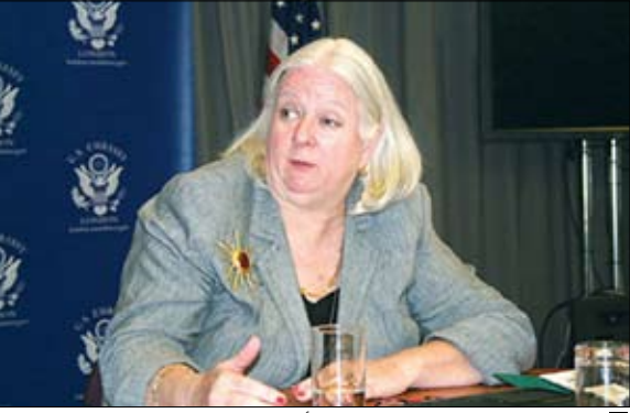
نائبية مساعد وزيرة الخارجية الأمريكية

واشنطن / متابعة : قالت نائبة مساعد وزيرة الخارجية الأمريكية لشؤون الشرق الأدنى جانيت ساندرسون أمام لجنة الشؤون الخارجية في مجلس الشيوخ أمس الأول الثلاثاء إن الحوار أمر حاسم لحل الأزمة السياسية في اليمن. وقالت ساندرسون في الوقت نفسه من أهمية إعلان المعارضة تشكيل مجلس رئاسي لإدارة البلاد.. مضيفة أنها تعتقد أن لخفامة الأخ الرئيس علي