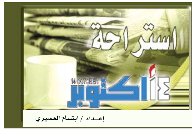
إعداد / ابتسام العسيري