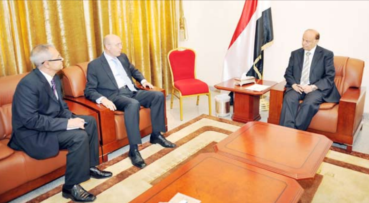
ويستقبل سفير جمهورية فرنسا