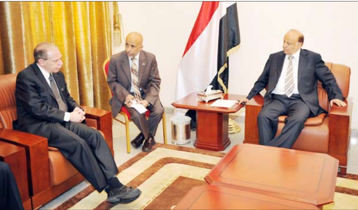
نائب الرئيس لدى استقباله سفير الولايات المتحدة الأمريكية أمس