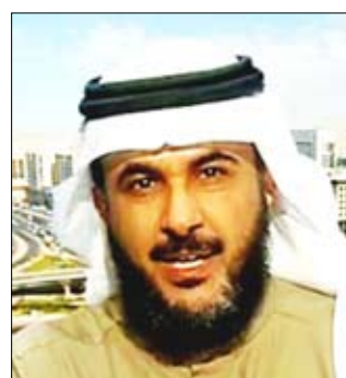
البروفسور طارق الحبيب

مرضى "الميل الجنسي للأطفال" يستغلون المجتمعات المفككة الفقيرة، ويستغلون فترات الحروب ليغتصبوا الأطفال ولمعالجة هذه المشكلة، دعا إلى عدم تعريض الطفل لمشاهدة ما يحدث في الحروب وإشغال الأطفال ببرامج التسلية واللعب، مع استمرارية عملية التعليم، وفي حال عدم القدرة على عزله عن الأحداث يأتي دور الأهل في توضيح الصورة للطفل بما لا يشعره بالرب.