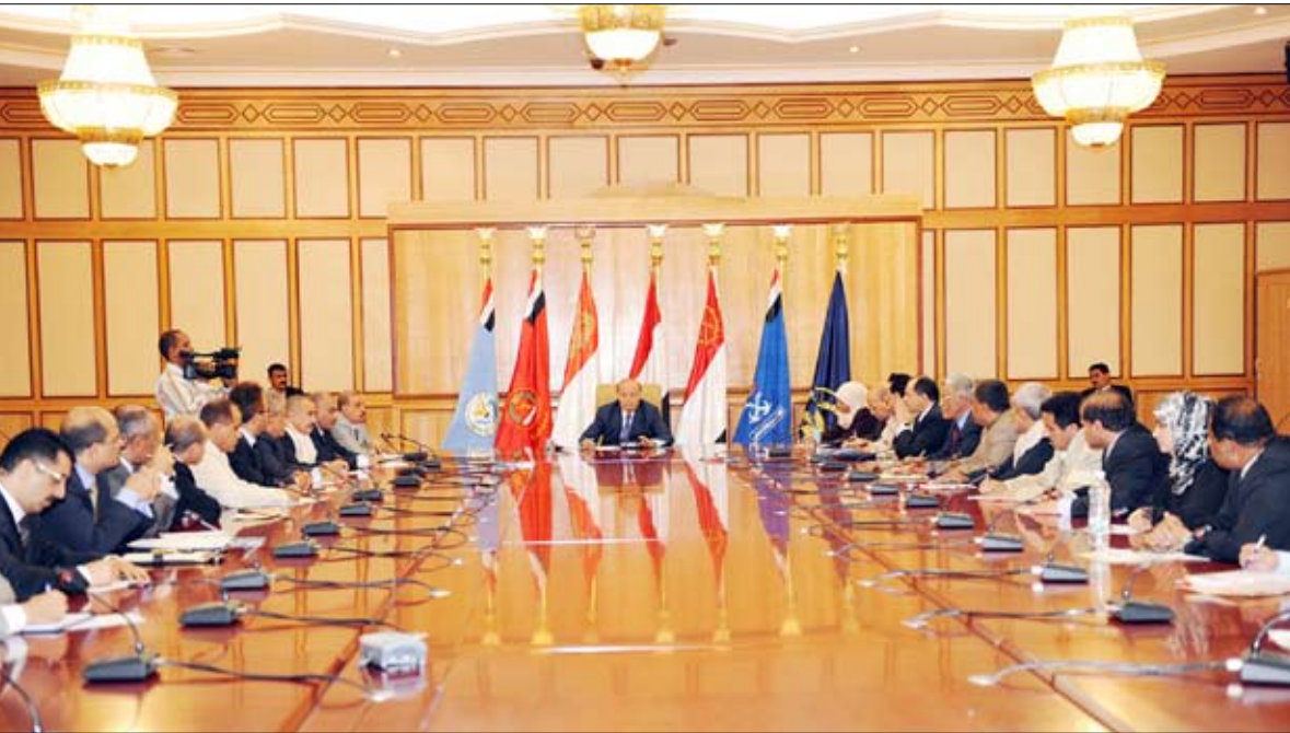
نائب الرئيس لدى ترؤسه الاجتماع المشترك للجنة العامة للمؤتمر الشعبي ومجلس الوزراء