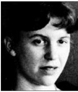
الشاعرة الأمريكية سيلفيا بلات