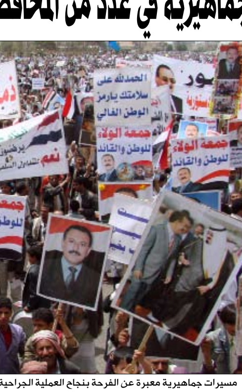
مسيرات جماهيرية معبرة عن الفرحة بنجاح العملية الجراحية التي أجريت لفخامة الرئيس