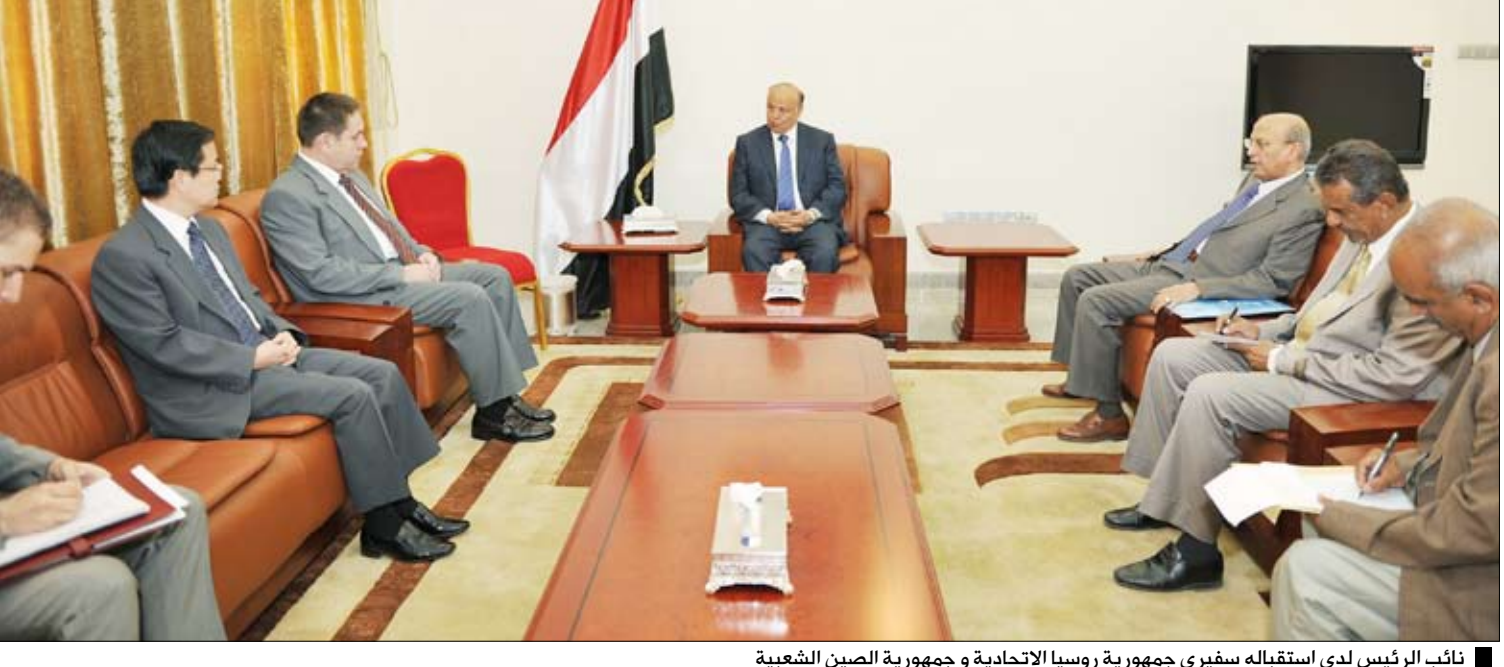
نائب الرئيس لدى استقباله سفير جمهورية روسيا الاتحادية وجمهورية الصين الشعبية

صنعاء / سبأ : استقبل الأخ عبد ربه منصور هادي نائب رئيس الجمهورية أمس سيرجي كوزولوف، سفير جمهورية روسيا الاتحادية و ليو دنگ لين، سفير جمهورية الصين الشعبية، بحضور الدكتور أبوبكر القربي وزير الخارجية. وفي اللقاء رحب نائب رئيس الجمهورية بالسفيرين واستعرض معهما جملة الأحداث والإجراءات واللقاءات والمشاورات التي تمت منذ التفجير الإرهابي في جامع النهدين بدار الرئاسة وما نجم عن ذلك الحادث الإجرامي من إصابات لكبار رجالات الدولة والحكومة وفي المقدمة فخامة الرئيس علي عبد الله صالح رئيس الجمهورية، مؤكداً أن فخامة الرئيس في وضع صحي متعاف وجيد وسيعود قريباً إلى أرض الوطن. وتطرق نائب الرئيس إلى لقاءاته بأحزاب (اللقاء المشترك) وأطراف المعارضة الأخرى التي تم خلالها التوافق على العمل الصارم لوقف إطلاق النار وفتح الطرقات وأخراج المسلحين من العاصمة، مبيناً أنه التقى نخبة من الشباب المعتصمين وتحاور معهم حول أعمال قطع الكهرباء والنفط والغاز وعدم تأمين الطرقات وسفك الدماء لجمرد خلاف حزبي أو غيره، مشيراً إلى أن الشباب تفهموا أن مثل هذه الأعمال التخريبية لا ترضي أحداً وأنها مخالفة للشرعية والمواثيق والأخلاق. واستعرض نائب رئيس الجمهورية تفاصيل مواجهات الجماعات الإرهابية من تنظيم القاعدة التي تجتمعت من مختلف المحافظات وربما من الخارج إلى محافظة أبين وبصفة خاصة في مدينتي زنجبار وجعار، مؤكداً أن القوات المسلحة والأمن كانت لهم بالمرصاد ولقتلهم درساً قاسياً. وأشار هادي إلى أن بعض تلك العناصر فروا إلى محافظة لحج وهناك قاموا بمهاجمة بعض المرافق الحكومية والخدمية إلا أن أبطال القوات المسلحة تصدوا لهم وكبدوهم خسائر فادحة في الأرواح والعتاد، كما تم طردهم من المرافق التي كانوا قد استولوا عليها.