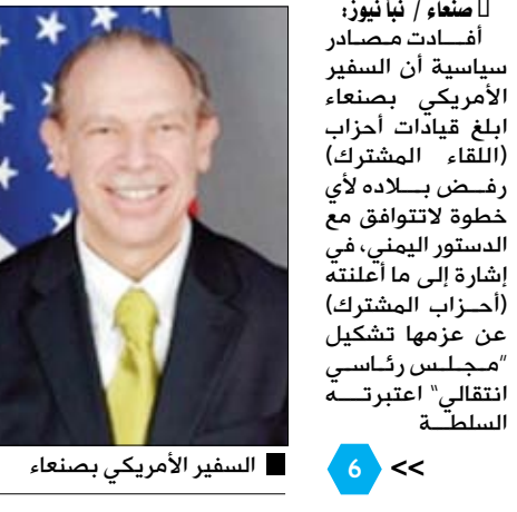
السفير الأمريكي بصنعاء