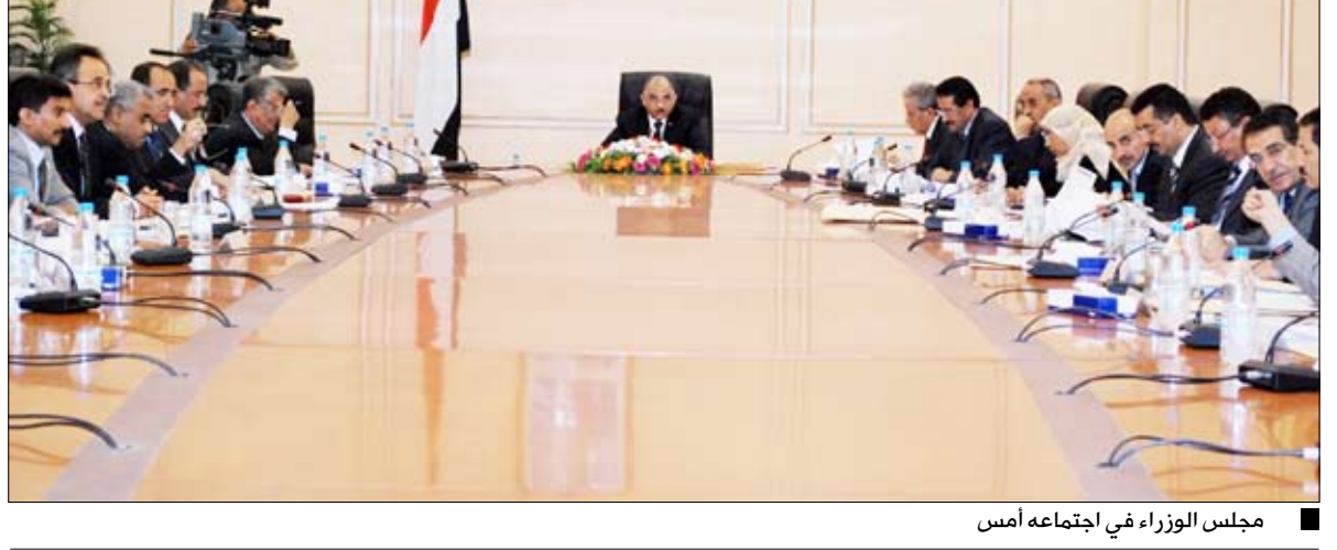
مجلس الوزراء في اجتماعه أمس

الحصر ليمتد الحصر الدقيق والقانوني للأضرار التي لحقت بجميع المنشآت الحكومية، كما وجه أمين العاصمة بحصر الأضرار التي لحقت بمنزل المواطنين بالحصة جراء اعتداءات عصابة أولاد الأحمر وذلك تمهيداً لإعادة أعمارها وتعويضهم عن الأضرار. ولدى استعراضه تقريراً عن أوضاع النازحين من أبين إلى محافظتي عدن ولحج جراء المعارك الجارية بين أفراد القوات المسلحة والأمن والعناصر الإرهابية من تنظيم القاعدة، أكد مجلس الوزراء دعم النازحين بتوفير كل ما يحتاجونه من متطلبات وخدمات ضرورية، وأثنى على الجهود التي تبذلها أمانة العاصمة لتسيير أول قافلة إغاثة شعبية للنازحين باعتبار ذلك وحياً مجلس الوزراء الأعمال البطولية التي يقوم بها رجال القوات المسلحة والأمن والمواطنون الشرفاء من أبناء المحافظة وما يبذلونه من جهد في هذه المهمة الوطنية لدحر فلول الإرهاب وتمشيط مدينة زنجبار من العناصر الإرهابية التابعة لتنظيم القاعدة. (التفاصيل من 3)