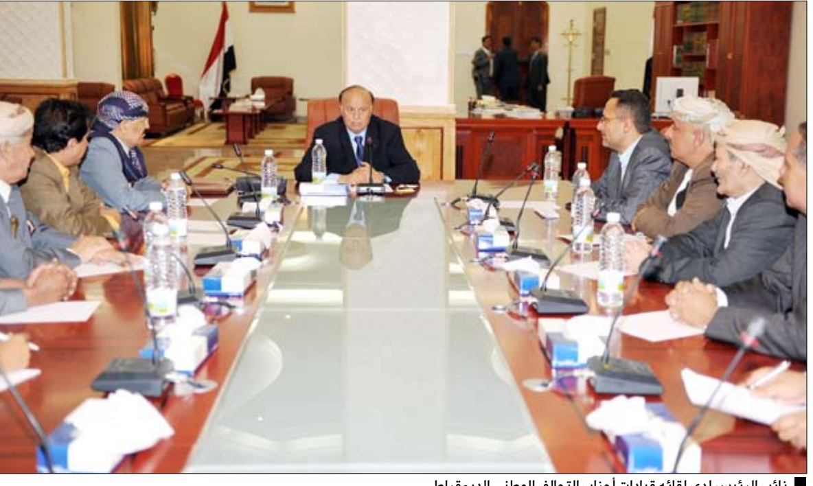
نائب الرئيس لدى لقائه قيادات أحزاب التحالف الوطني الديمقراطي

تلقى فخامة الأخ الرئيس علي عبدالله صالح رئيس الجمهورية أمس اتصالاً هاتفياً من أخيه خادم الحرمين الشريفين الملك عبد الله بن عبدالعزيز آل سعود ملك المملكة العربية السعودية الشقيقة الذي أطمان خلاله على صحة فخامة رئيس الجمهورية، متمنياً له الشفاء العاجل وموفور الصحة والعافية. وأكد خادم الحرمين الشريفين موقف المملكة الداعم ليمين موحد آمن ومستقر، متمنياً أن تتجاوز بلادنا الأزمة الراهنة. ومن جانبه جدد فخامة الرئيس شكره وامتنانه لخادم الحرمين الشريفين