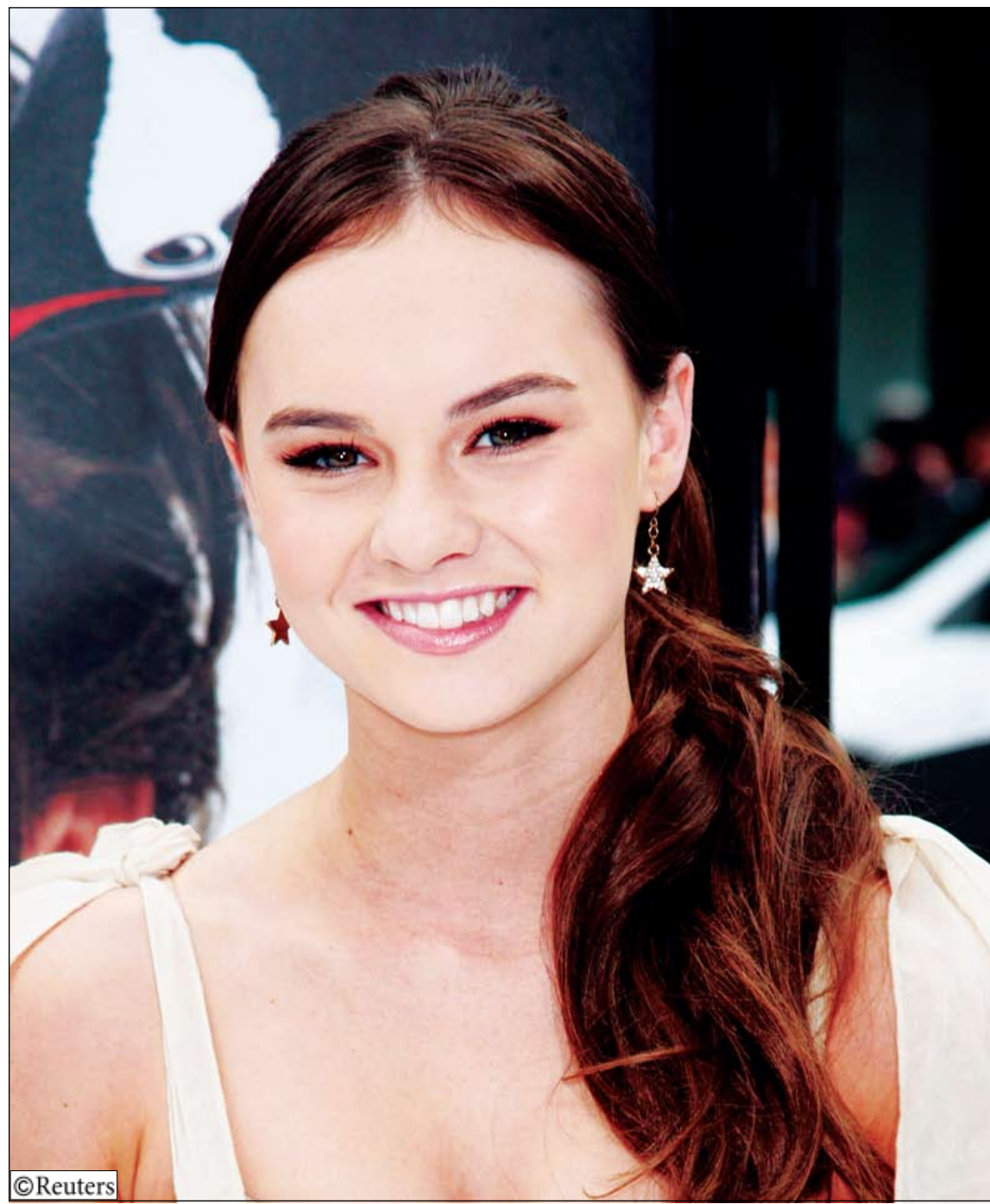
الممثلة مادلين كارول لدى وصولها لحضور العرض الأول لفيلم (طيور بطريق السيد بوبر) في هوليوود بولاية كاليفورنيا.