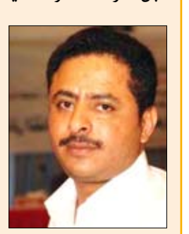
عبدالله الملك المهندي

تصريح وزيرة الخارجية الأمريكية عن اليمن التي وصفت فيه الدستور اليمني بالدستور القوي، وأكدت أن أي تحول أو انتقال أو تغيير يجب أن يتم وفقاً للدستور.. هو تصريح بلا شك يستحق الوقوف أمامه باعتباره يعكس إدراكاً ولو متأخراً من قبل المجتمع الدولي حيال الأزمة السياسية في اليمن.. منذ بداية الأزمة السياسية التي تشهدها البلاد والقيادة السياسية ممثلة بفخامة الرئيس علي عبدالله صالح رئيس الجمهورية، وأيضاً قيادة المؤتمر الشعبي العام تؤكد أن أي تغيير لا بد أن يكون وفقاً للدستور وفي إطار الشرعية الدستورية.. لكن مثل هذا الحديث ظل يقابل بأذان صماء من قبل أطراف المعارضة اليمنية وتحديدًا أحزاب اللقاء المشترك.