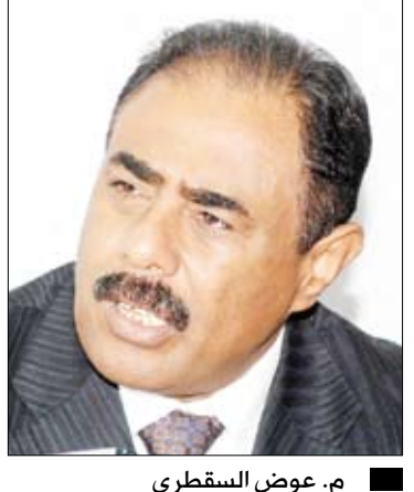
م. عوض السقطري

□ صنعاء / متابعات: أكد المهندس عوض السقطري وزير الكهرباء والطاقة أن الانقطاعات الملحوظة للتيار الكهربائي خلال الفترة الأخيرة ناتجة عن الأعمال التخريبية التي تتعرض لها خطوط النقل من محطة مأرب الغازية إلى صنعاء بصورة تؤدي إلى خروج المحطة عن الخدمة. وأوضح أنه في عصر يوم الاثنين الماضي تعرض خط النقل 400 كيلوفولت من مأرب إلى صنعاء للاعتداء مجدداً في منطقة الدماشقة محافظة مأرب من قبل عناصر تخريبية ليكون هذا الاعتداء 25 منذ مطلع العام الحالي وهو الأمر الذي يتسبب بالانقطاعات المتكررة للتيار الكهربائي جراء حالة العجز الناجمة عن ذلك حيث تصل نسبة العجز إلى أكثر من 40٪ نتيجة لخروج محطة مأرب عن الخدمة. وأوضح وزير الكهرباء أن العمل جارٍ لإصلاح تلك الأضرار من قبل الفرق الفنية والهندسية التابعة للمؤسسة العامة للكهرباء من أجل إعادة العمل في المحطة وتحسين مستوى الخدمة إلى المستوى الذي كانت عليه خلال الأسبوع القادم