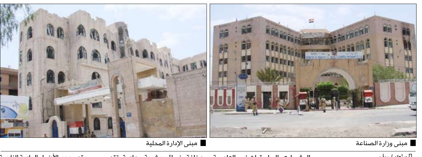
مبنى وزارة الصناعة

صنعاء / سبأ : تسلمت الجهات الحكومية أمس، مقراتها في منطقة الحصبة بأمانة العاصمة، التي تم تطهيرها من العصابات المسلحة التابعة لأولاد الأحمر يومي الأربعاء والخميس الماضي، في إطار جهود تثبيت وقف إطلاق النار وإنهاء المظاهر المسلحة وازالة المتارس من الشوارع والطرق في العاصمة صنعاء. وكانت عصابات اولاد الأحمر المسلحة قامت في الـ 23 من مايو الماضي بالاعتداء بأسلحة رشاشة متوسطة وإطلاق قذائف "بوزيك" و"ار بي جي" وصواريخ محمولة "لو"، على المنشآت والمقرات الحكومية في منطقة الحصبة، وخلفت خسائر بشرية ومادية تقدر بمليارات الريالات. وشملت الهجمات التي تم استلامها وزارات الصناعة والتجارة وإدارة المحلية والسياحة ووكالة الأنباء اليمنية سبأ والهيئة العامة للأراضي والمساحة ومدرسة الرماح للبنات، ومشروع مكافحة الجراد.