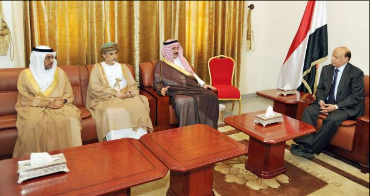
نائب الرئيس أثناء استقبله سفراء السعودية والإمارات وسلطنة عمان

صنعاء / سبأ : استقبل الأخ عبد ربه منصور هادي نائب رئيس الجمهورية أمس سفراء كل من المملكة العربية السعودية علي الحدان وسلطنة عمان عبد الله البادي ودولة الإمارات العربية المتحدة عبد الله مطر المزروعى . وخلال اللقاء استعرض نائب رئيس الجمهورية مجريات الأحداث الراهنة على الساحة الوطنية والإجراءات التي تمت لتثبيت وقف إطلاق النار وتحرك لجنة مشتركة لمعالجة الآثار المترتبة على ذلك وفي مقدمتها إخلاء المؤسسات والمباني الحكومية من المسلحين وإنهاء المظاهر المسلحة من الشوارع والطرق في العاصمة صنعاء ، خاصة بعد الاعتداء الإجرامي الذي استهدف فخامة الأخ الرئيس علي عبد الله صالح رئيس الجمهورية وكبار قادة ومسؤولي الدولة أثناء أدايتهم صلاة الجمعة بمسجد النهدين في دار الرئاسة . وأكد الأخ عبد ربه منصور هادي أهمية تعاون دول مجلس التعاون الخليجي لمساعدة اليمن على الخروج من هذه الأزمة .. وثنى عالياً مبادرة خادم الحرمين الشريفين الملك عبد الله بن عبد العزيز آل سعود ملك المملكة العربية السعودية ، في تقديم ثلاثة ملايين برميل نفط خام تصل ثبعا لمصافي عدن بمعدل مائة ألف برميل يوميا للتخفيف من أزمة المشتقات النفطية في اليمن . وأعرب نائب رئيس الجمهورية عن امله في تجاوز هذه الأزمة بتعاون كل الأشقاء والأصدقاء . من جانبهم عبر السفراء الخليجيون عن إدانتهم الشديدة للحادث الإجرامي الذي استهدف فخامة رئيس الجمهورية وكبار مسؤولي الدولة في جامع النهدين بدار الرئاسة وفي بيت الله سبحانه وتعالى وفي يوم عظيم، والذي لا يقره دين أو شرع أو عرف .. مؤكداً استعداد بلادهم لتقديم المساعدات المطلوبة لليمن لتجاوز الظروف الصعبة الراهنة .