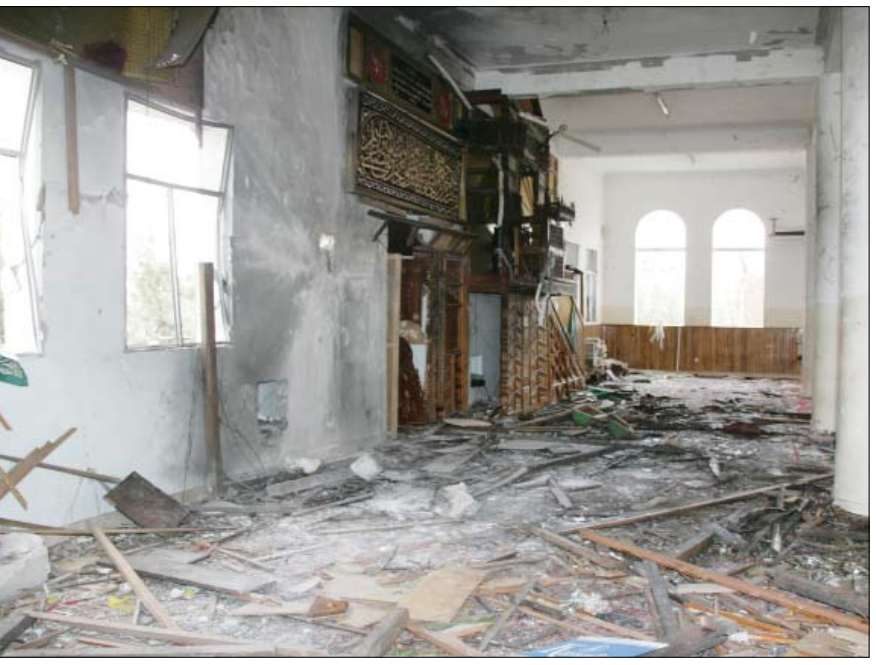
مسجد النهدين بعد الحادث الإجرامي

صنعاء / سبأ : استنكر مشايخ وعقال وأعيان وأفراد قبائل حاشد الحادث الإجرامي الفعير الذي استهدف فخامة الأخ علي عبد الله صالح رئيس الجمهورية وكبار مسؤولي الدولة أثناء أدايتهم لصلاة الجمعة بمسجد النهدين في دار الرئاسة . وعبروا في رسالة رفعوها لفخامة الأخ علي عبدالله صالح رئيس الجمهورية عن إدانتهم الشديدة لهذا الحادث الإجرامي البشع، الذي اهتز لهوله وجدان شعبنا اليمني والعربي والإسلامي والضمير الإنساني. مؤكداً وقوفهم مع فخامة الأخ الرئيس وأبطال القوات المسلحة والأمن، للذود عن حياض الوطن وحماية كافة الثوابت والمكتسبات الوطنية، وفاءً لقوافل الشهداء وأنهار الدماء التي قدمتها قبائل حاشد وغيرها، لتثبيت دعائم الثورة اليمنية المجيدة (سبتمبر وأكتوبر) والوحدة الوطنية المباركة والنظام الجمهوري المرتكز على الديمقراطية والتعددية السياسية. وفي ما يلي نص الرسالة : إلى رمز اليمن وباني نهضته الحديثة المناضل الجسور فخامة الأخ الرئيس علي عبدالله صالح رئيس الجمهورية الأكرم حياكم الله وأباكم ومن كل شر ومكرهه وتفاكم..والسلام عليكم ورحمة الله وبركاته.