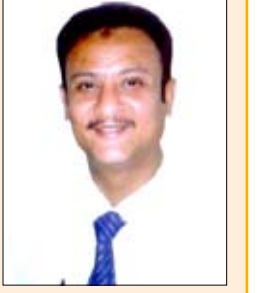
محمد حسين النظاري

عادة ما يرتبط الاحتفال والسرور بالأمر الطيبة التي تعود بالخير على الوطن والمواطنين، هذا عند الأسوياء من الناس، لأن هذا ما جبلت عليه النفس البشرية السوية ، غير أن ما حدث من بلاء كبير الم بالجمهورية اليمنية في الفاتح من رجب 1432هـ الموافق للثالث من يونيو 2011م ، وتمثل في اعتداء جمع خمسة محرمات في مكان واحد وأولها استباحة النفس التي حرم الله قتلها إلا بالحق ، وثانيها الخروج بالسلاح على ولي أمر المسلمين ، وثالثها التعدي على حرمة دور العبادة والمتمثل بقصف مسجد النهدين ، ورابعها قتل ضيوف الرحمن في بيته وهم ساجدون ، وخامسها انتهاك حرمة شهر رجب الحرام الذي كان معظما حتى في الجاهلية الأولى، والأدهى من ذلك انه حصل في أول يوم منه مما يؤكد الإصرار على ارتكاب القتل الحرام للنفس الحرام في المكان الحرام والشهر الحرام .