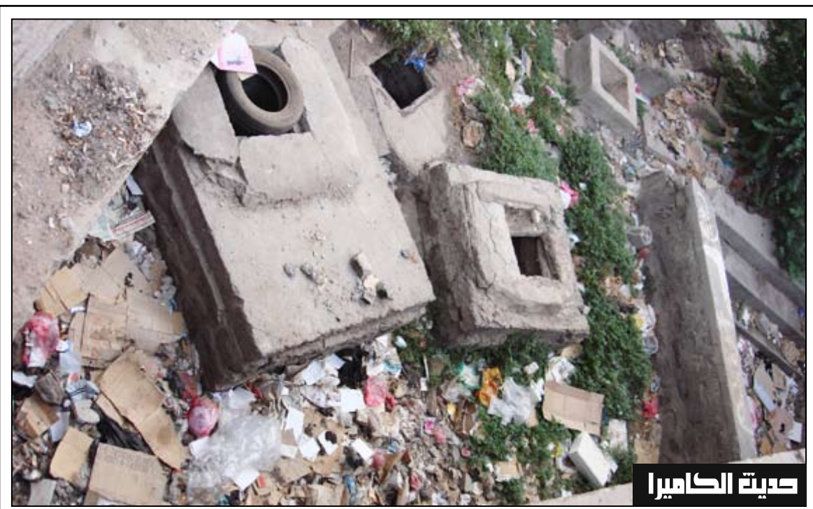
الممر الموجود بين شركة التأمين والغرفة التجارية والبنك في مدينة عدن تحول إلى مكب للقمامة ومخلفات قضاء الحاجة لبعض الناس كحمام على الهواء .. نتمنى من جهات الاختصاص المتابعة والعمل للحد من تكرار هذا المنظر الذي يضر الجميع ويشوه المنظر الجمالي.

أعلن المذبح التبشيري هارولد كامبينج الذي كان قد «حسب» موعد يوم القيامة» على أساس نصوص الانجيل أنه أخطأ بالحسابات وأن الموعد الدقيق هو 21 أكتوبر القادم. وعبر كامبينج عن أسفه بسبب «الخطأ في الحسابات»، ولكنه قال إنه لا يستطيع أن يقدم نصائح مالية لأولئك الذين أنفقوا مدخراتهم اعتماداً على أن يوم القيامة قد حل. وكان كامبينج قد «تنبأ» سابقاً بأن الموعد هو 21 مايو، حيث سيصعد المؤمنون الحقيقيون إلى السماء بينما ستبديد هزة أرضية كبرى من بقي على الأرض. وكان البعض قد تبرعوا بممتلكاتهم على اعتبار أنهم سيصعدون إلى السماء ولن يحتاجوا إليها. وشعر الكثيرون بخيبة أمل وحزن حين مضى اليوم دون أن يحدث شيء. وقال جيف هوكينز وهو منتج تلفزيوني متقاعد أنفق مدخراته على الدعاية ليوم القيامة «لقد سخر البعض مني ولعنوني». يذكر أن كامبينج لم يظهر على الملا منذ يوم السبت، ثم ظهر في برنامج إذاعي عاصف للإجابة على أسئلة المستمعين.