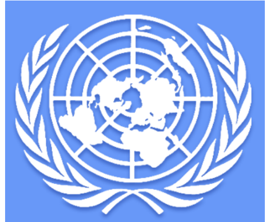
إعداد / مشتاق محمد يحيى

الدوحة / 14 أكتوبر / رويترز: جدد الرئيس الفلسطيني محمود عباس يوم أمس الجمعة تمكسه بالذهاب إلى الأمم المتحدة في سبتمبر أيلول من أجل الحصول على الاعتراف بالدولة الفلسطينية إذا لم يتم التوصل إلى ذلك عبر المفاوضات مع الجانب الإسرائيلي. وقال عباس في مقابلة مع رويترز لدى وصوله العاصمة القطرية الدوحة للمشاركة في اجتماع لجنة المتابعة العربية لمبادرة السلام «بالنسبة لاجتماع لجنة المتابعة العربية سبتمبر الحادي عشر من الشهر المقبل، فإنني سأطلب من الرئيس الإسرائيلي (بنيامين نتانياهو) وسنستعرض مع لجنة المتابعة الخطوات التي سنقوم بها والتي تتمثل في الإصرار على المفاوضات كطريق أساسي للحل وإذا فشلنا في الوصول إلى