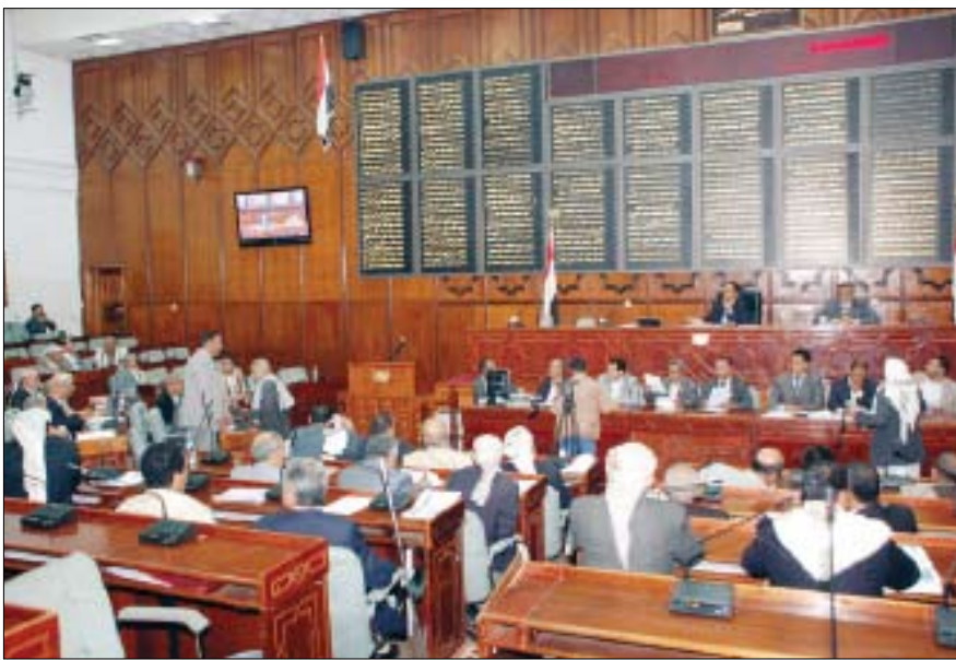
مجلس النواب / ارشيف

صنعاء / سبأ : وافق مجلس النواب في جلسته المنعقدة صباح أمس برئاسة رئيس المجلس يحيى علي الراعي على انضمام بلادنا ممثلة بوزارة الكهرباء والطاقة إلى عضوية الوكالة الدولية للطاقة المتجددة (الأرينا) بعد مناقشته في ضوء تقرير لجنة الخدمات. وأستمع المجلس إلى تقرير لجنة النقل والاتصالات بشأن مشروع قانون الموانئ البحرية حيث يتكون مشروع القانون من (39) مادة موزعة على عشرة فصول تناولت التسمية والتعاريف والأهداف العامة