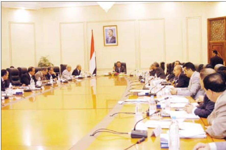
د. مجور لدى ترؤسه اجتماع مجلس الوزراء أمس

صنعاء / سبأ : أقر مجلس الوزراء في اجتماعه الأسبوعي أمس برئاسة رئيس المجلس الدكتور علي محمد مجور المصفوفة التنفيذية لتوصيات الندوة الخاصة بالحملة الثانية لإنقاذ مدينة صنعاء القديمة. ووجه وزارة الثقافة بالتنسيق مع الأمانة العامة لمجلس الوزراء بإعداد برنامج زمني تنفيذي للتوصيات. وأكد على نواب رئيس الوزراء والزوار كل فيما يخصه مباشرة تنفيذ المشاريع والأنشطة الخدمية والتنمية المخصصة لمدينة صنعاء القديمة، واستكمال وتجديد في موازنتها للعام الجاري 2011م وذلك وفقاً للبرنامج الزمني للمصفوفة وعلى أن يتم إدراج غير المعتمد منها في مشاريع موازنتها السنوية للأعوام القادمة. وتغلي المصفوفة التنفيذية جوانب تعزيز القدرة المؤسسية والمالية للهيئة العامة لمحافظة صنعاء القديمة، على المدن التاريخية، واستثمار المقومات التاريخية والثقافية والعمرانية لمدينة صنعاء القديمة، واستكمال وتجديد الوثائق المرجعية للمحافظة على المدن المدينة وطابعها المعماري المتميز، فضلاً عن استكمال المشاريع الخدمية والتنمية بما ينسجم وخصوصية هذا الطابع المعماري واتخاذ الإجراءات العاجلة الكفيلة بحمايته من المخالفات وأي تشوهات تلطبعه العالمي الفريد.