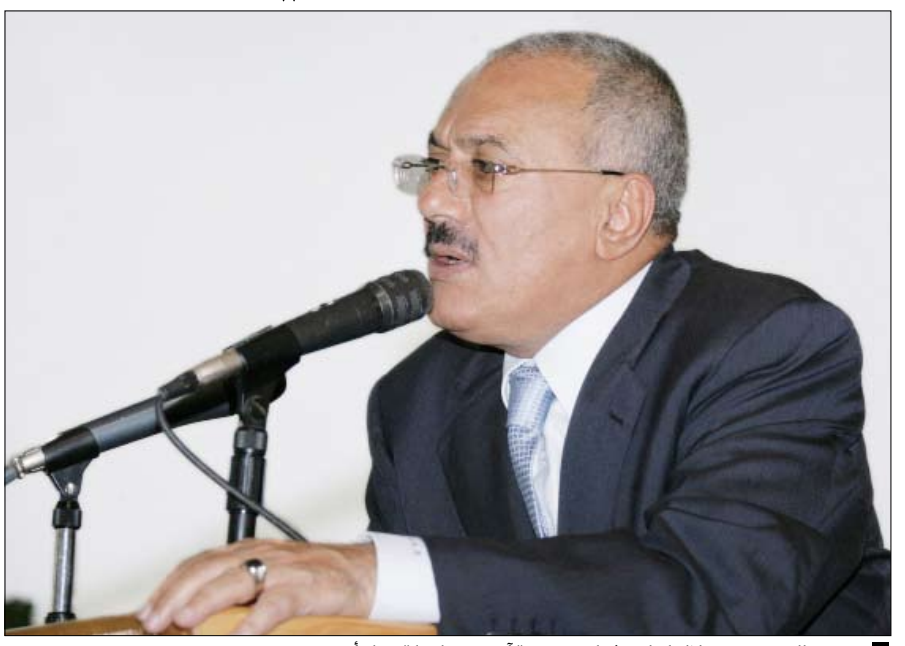
رئيس الجمهورية خلال لقائه شباب مديرية أنس محافظة ذمار أمس

ونحن نشمن عاليا هذه المواقف لأنس البطلة ونعزج بكم اشد الاعتزاز". وأضاف "نشكركم على جهودكم وثباتكم لمواجهة التحدي الذي يتعرض له الوطن أما الفاسدون فهم الذين ذهبوا إلى مايسمى بساحة التقرير وهم الذين أسأفوا للنظام وكانوا محسوبين عليه ثم تخاذلوا ومثل هؤلاء ذهبوا غير مأسوف عليهم... متمنيا لهم جميعا النجاح لما فيه خدمة الوطن. حضر اللقاء رئيس مجلس الوزراء الدكتور علي محمد مجور وزير الدولة عضو مجلس الوزراء عبد القادر علي هلال.