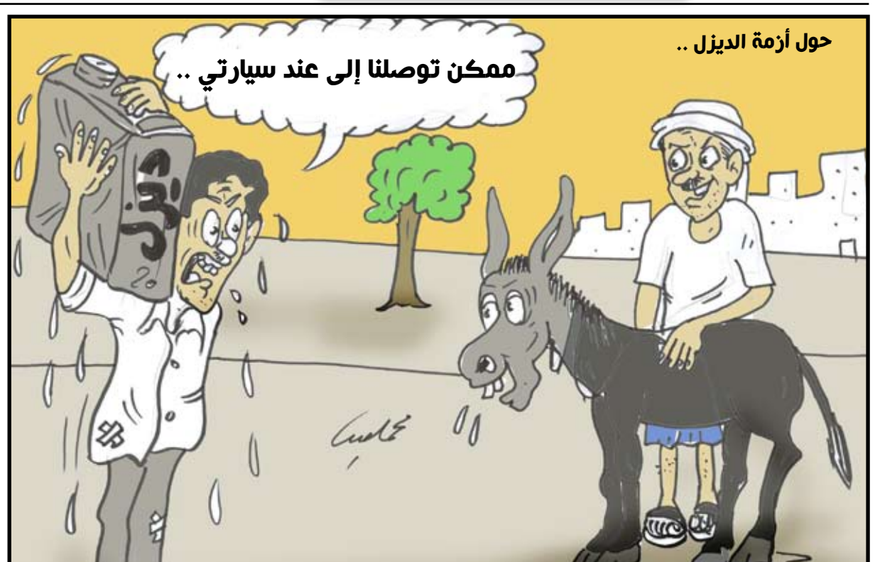
حول أزمة الديزل ..