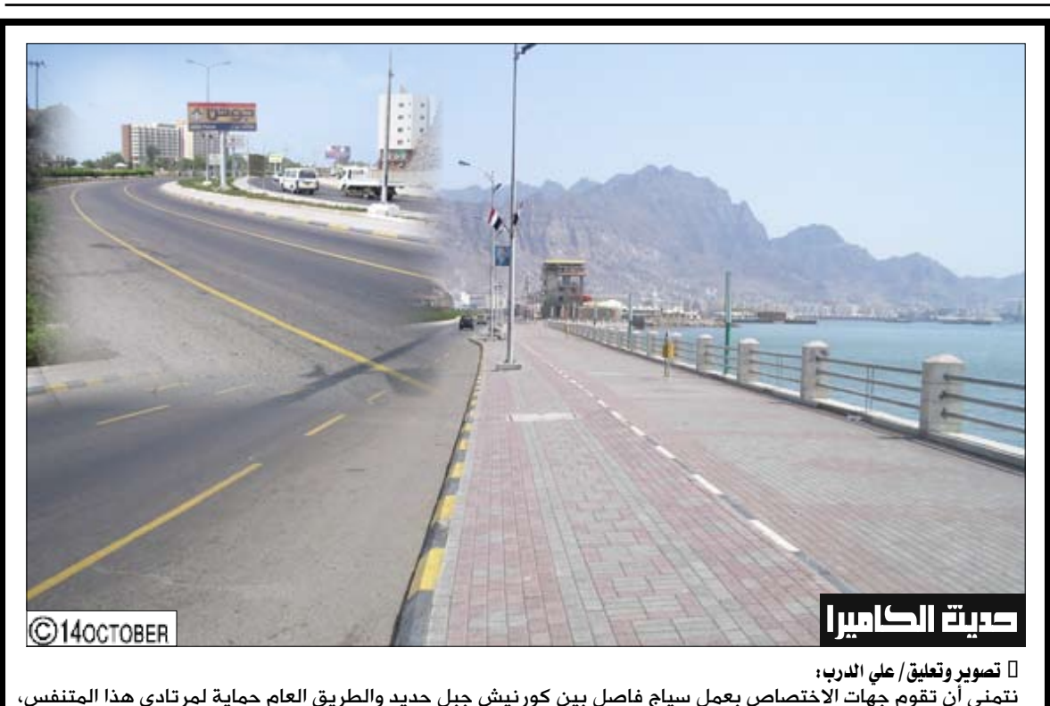
تصوير وتعليق / علي الدرب: نتمنى أن تقوم جهات الاختصاص بعمل سياج فاصل بين كورنيش جبل حديد والطريق العام لحماية لمرطادي هذا المتنفس، خصوصاً الأطفال، من حوادث السير.

(30) مهاجراً إفريقيا يختبئون في البطيخ ضبطت وزارة الداخلية المصرية 30 شخصاً من عدة دول إفريقية مختبئين أسفل شحنة من البطيخ بشاحنة. وبحسب صحيفة «الأهرام»، أن هذه الواقعة تعد واحدة من أغرب قضايا الهجرة غير الشرعية، وتم ضبط المهاجرين داخل الشاحنة قبل عبورها قناة السويس مباشرة باتجاه شبه جزيرة سيناء، وكان من بين المهاجرين مختبئين ثلاثة أطفال وسيدة.