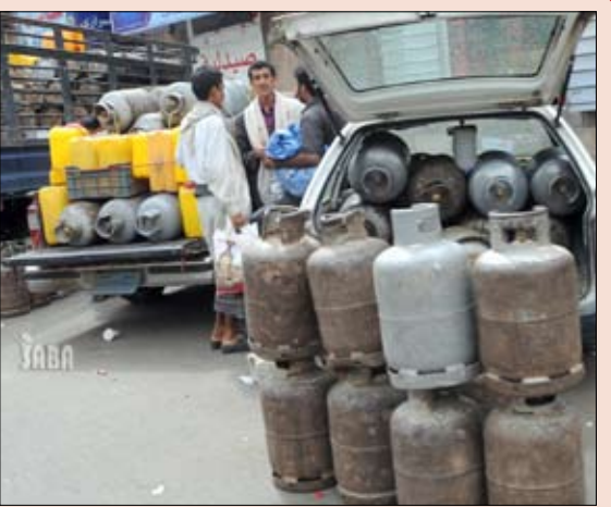
سيارات الأجرة تحولت إلى مفارش لبيع الغاز بأرصفة شوارع العاصمة صنعاء

ع/ المحويت/ سيا: ضبط المواطنون بمديرية الرجم بمحافظة المحويت عصابة مكونة من ثلاثة أشخاص أقدمت على سرقة كابل اتصالات لشبكة الهاتف الثابت يربط عدداً من قرى وعزل المديرية بالشبكة الموحدة للمحافظة ما أدى إلى انقطاع كلي لخدمات الاتصالات الهاتفية الثابتة بالمديرية. وقد حدثت في مديريات الرجم والاتصالات بالمحويت المهندس جلال الزوكا أن المواطنين الذين يمثلون إحدى اللجان الشعبية المكلفة بحراسة المباني والمنشآت العامة من أبناء عزلة البشاري بمديرية الرجم ضبطت