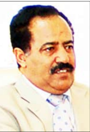
يحيى علي الراعي

صنعاء / سبأ : أجرى رئيس مجلس النواب يحيى علي الراعي اتصالات هاتفية مساء يوم أمس الأحد مع نظرائه الأشقاء رؤساء مجالس النواب والشورى في دول مجلس التعاون الخليجي منهاهم فيها وجهامير الشعب الخليجي بعيد العمال العالمي . وتبادل معهم الأحاديث الودية والأخوية في ما يتعلق بتعزيز العلاقات الثنائية البرلمانية بين بلدنا وبلد كل منهم . كما جرى أثناء تلك الاتصالات التطرق إلى تطورات الأوضاع في المنطقة ومنها الأوضاع في بلادنا . وتضمن رئيس مجلس النواب دور الأشقاء في مجلس التعاون الخليجي ومواقفهم الإيجابية تجاه الأوضاع في اليمن ودعمهم لوحدتها وأمنها واستقرارها الذي يعد جزءا لا يتجزأ من أمن واستقرار المنطقة بكاملها.