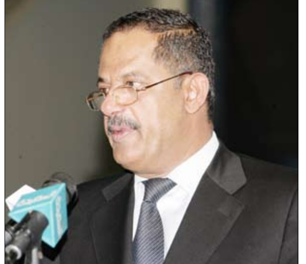
د. مجور يلقي كلمته بمناسبة عيد العمال العالمي أمس

صنعاء / سبأ : أكد الدكتور علي محمد مجور، رئيس حكومة تصريف الأعمال، دعم الحكومة المطلق للعمال والعمالات في اليمن، الذي قال إنهم يتمتعون بالحد الذي يمكن الرضا عنه من الحقوق التي تعززت مؤخرا من خلال تنفيذ عدد من الاستحقاقات القانونية. ولدى حضوره الفعالية التي أقيمت أمس بصنعاء احتفاء بعيد العمال العالمي، أوضح مجور أن أبرز تلك الاستحقاقات شملت تنفيذ المرحلة الثالثة من الاستراتيجية الوطنية للأجور والمرتبات وإقرار صرف العلاوات السنوية للفترة 2005 - 2011م وتثبيت المعاقدين في الكثير من الجهات بمن فيهم عمال وعاملات النظافة. وقال مخاطبا العمال: «كنتم ومازلتم ركيزة من ركائز الدفاع عن الوطن ووحدته ونظامه الجمهوري وركيزة أساسية من ركائز التنمية ونحن نغول على دوركم في إفشال المحاولات التي يقوم بها البعض وتتقاطع في أهدافها وغاياتها النهائية مع ثوابت الوطن وترمي إلى تحطيم منجزاته العظيمة والإجهاز على مشروعه النهوضي القائم على الوحدة والديمقراطية والتنمية».