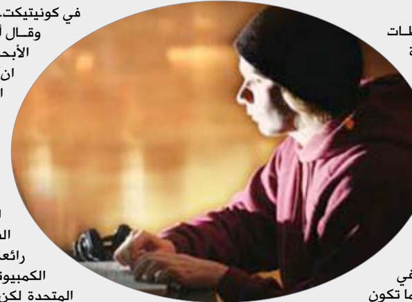
واشنطن / متابعة : أعلنت السلطات الأمريكية عن واحدة من أكبر انتصاراتها ضد الجرائم الإلكترونية بعد أن فككت شبكة استخدمت فيروساً كترولوجياً للسيطرة على أكثر من مليوني جهاز كمبيوتر على مستوى العالم في إطار عملية سطو ربما تكون أسفرت عن سرقة ما يزيد على 100 مليون دولار.

وقالت وزارة العدل الأمريكية أن فيروساً يسمى (كورفلاذ) أصاب أكثر من مليوني جهاز كمبيوتر وأخضعها لسيطرة مرسل الفيروس لسرقة الوثائق المصرفية وغيرها من البيانات الحساسة التي يستخدمها مرسل (كورفلاذ) في سرقة أموال من خلال الاحتيال في صفقات مصرفية ومعاملات مالية إلكترونية. وفككت السلطات الأمريكية الشبكة التي عملت لنحو عشر سنوات عن طريق مصارة محركات الأقراص الصلبة المستخدمة في إدارة الشبكة بعد الحصول على إذن محكمة