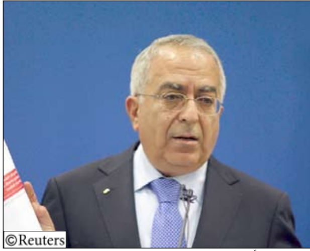
وزير الأسرى والمحربين الفلسطينيين عيسى قراقع