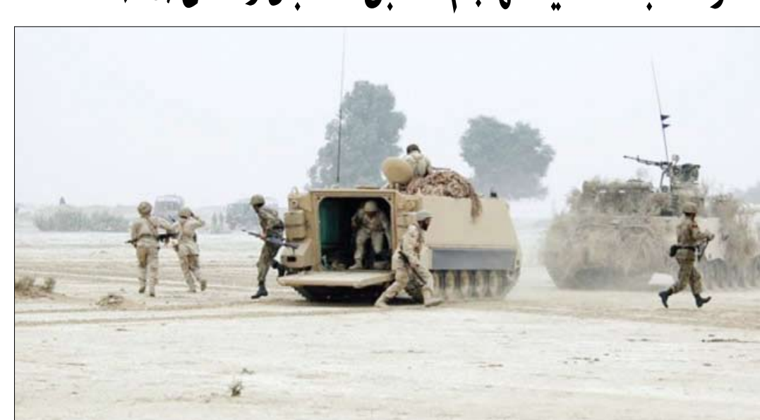
جنود باكستانيون خلال عملية عسكرية لمهاجمة مخابئ طالبان

بيشاور (باكستان) 14 أكتوبر/ رويترز : أكد مسؤول حكومي أن القوات الباكستانية وقوات الأمن مدعومة بطائرات هليكوبتر ومقاتلات استهدفت مواقع لطالبان في منطقة (مهمند) قبيلة قرب الحدود الأفغانية يوم كوناشر بشرق أفغانستان لملاحقة المتشددين المرتبطين بالقيادة وطالبان.