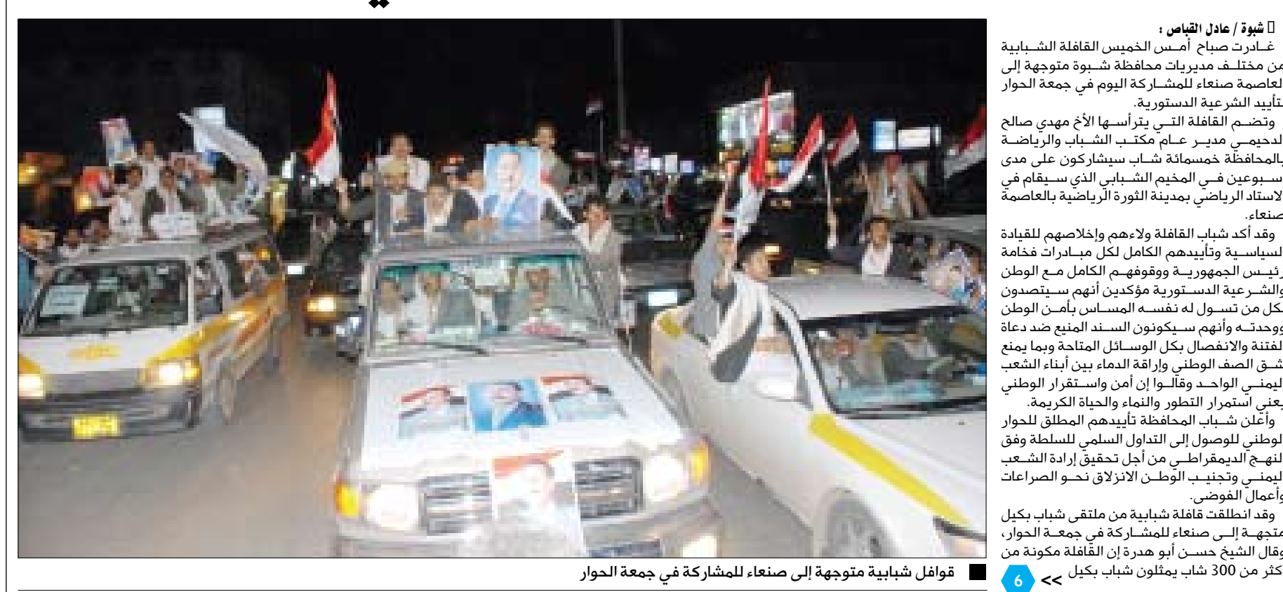
قوافل شبابية متوجهة إلى صنعاء للمشاركة في جمعة الحوار