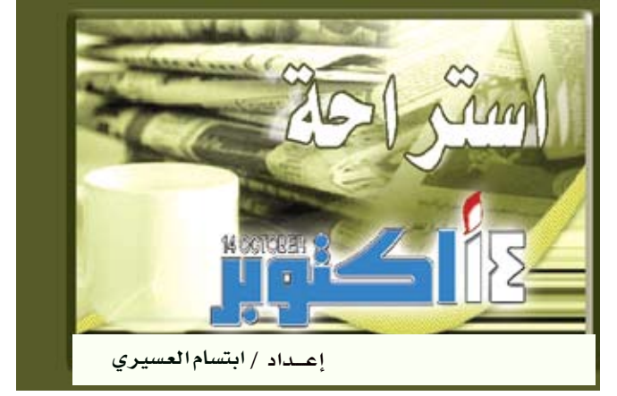
إعداد / ابتسام العسيري

إبراهيم / متابعة : أشارت دراسة تشيكية أعدتها معهد الصحة العامة في براغ إلى أن استخدام منشفات الأيدي الكهربائية يزيد بشكل بارز من كمية البكتيريا على أيدي مستخدميها مؤكدة أن نسبة البكتيريا ترتفع 24 بالمائة في حال عمل الجهاز على مبدأ الهواء الساخن في حين أن استخدام المناديل الورقية لمرة واحدة يخفض عدد البكتيريا على اليد بمقدار 77٪ بمعدل وسطي. وحذرت الدراسة من استخدام الصابون المتجمد في الأماكن العامة لأن البكتيريا تبقى في الأماكن التي يوضع فيها الصابون ناصحة باستخدام الصابون من النوع