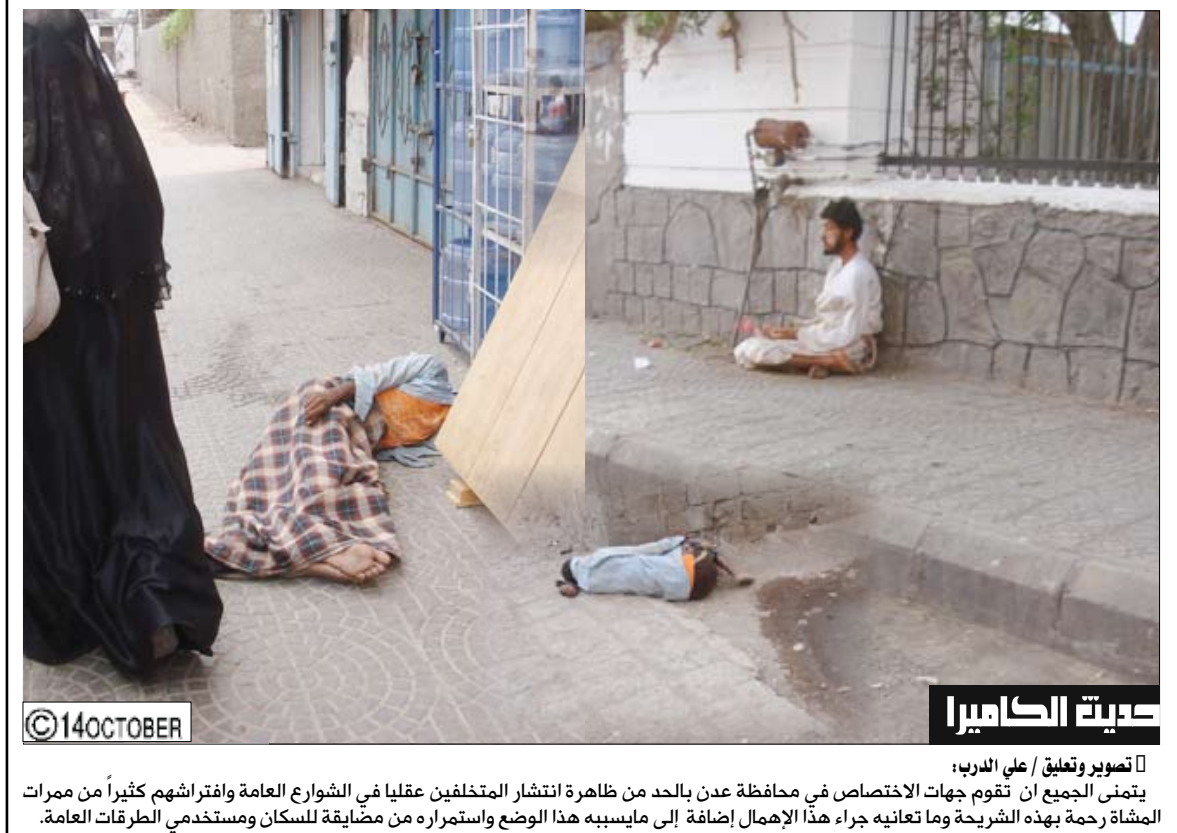
حياة الكاميرا ❏ تصوير وتعليق / علي الدرب: يتمنى الجميع أن تقوم جهات الاختصاص في محافظة عدن بالحد من ظاهرة انتشار المتخلفين عقليا في الشوارع العامة وأفتراشهم كثيراً من ممرات المشاة رحمة بهذه الشريحة وما تعانيه جراء هذا الإهمال إضافة إلى مايسببه هذا الوضع واستمراره من مضايقة للسكان ومستخدمي الطرقات العامة.