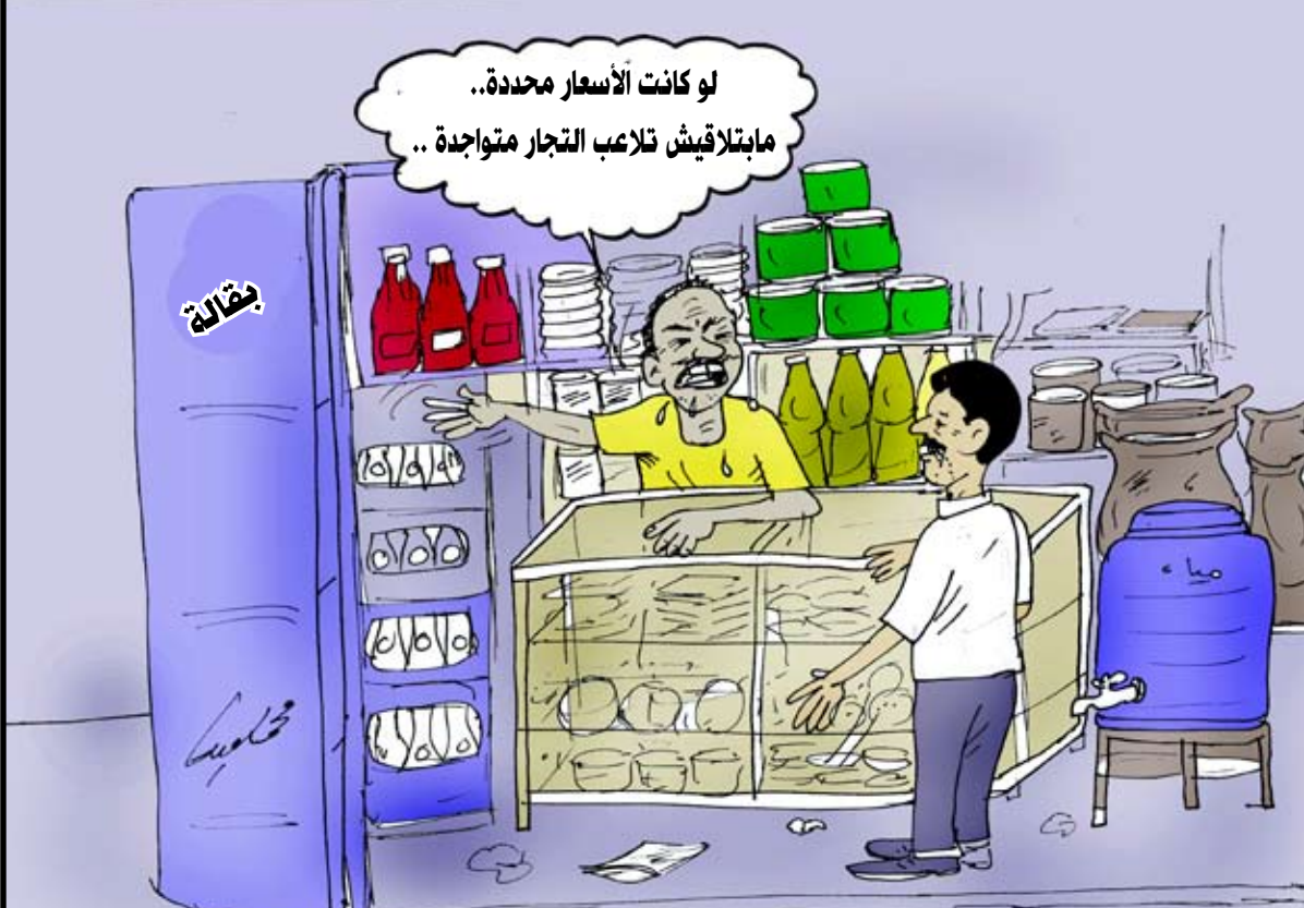
لو كانت الأسعار محددة.. مايتلاقيش تلاعب التجار متواجدة..