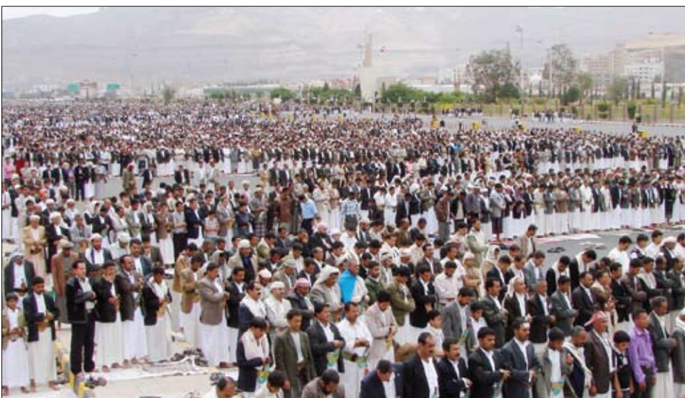
ملايين المواطنين يؤدون صلاة «جمعة التسامح» في العاصمة صنعاء أمس

□ صنعاء / سبأ : أدى الملايين من أبناء اليمن يوم أمس الجمعة صلاة جمعة التسامح في ميدان التحرير بالعاصمة صنعاء وميدان السبعين والشوارع والأحياء المحيطة بهم. وفي خطبتي صلاة الجمعة أكد الخطيب أهمية الوحدة الوطنية والاصطفاف الوطني والاحتكام لشرع الله تعالى «واعتصموا بحبل الله جميعاً ولا تفرقوا واذكروا نعمت الله عليكم إذ كنتم أعداء فألف بين قلوبكم فأصبحتم بنعمته إخواناً وكنتم على شفا حفرة من النار فأنقذكم منها». صق الله العظيم . وقال: «إن من حق أوطاننا علينا أن ننعسى إلى رفع شأنها بنهش الميادين وان نتعاون في مواصلة بناء الصرح الشامخ للوطن العزيز بإخلاص وهممة عالية لبننة لبناء واحدنا متماسكا كالبنان أو كالبنين يشد بعضه بعضا