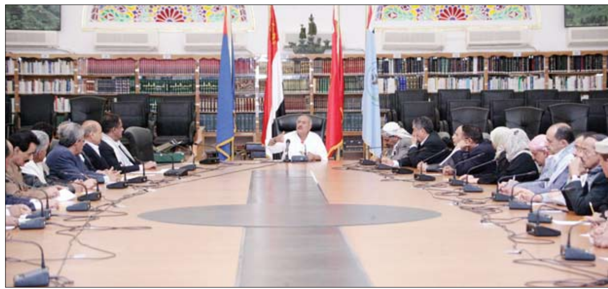
رئيس الجمهورية أثناء ترؤسه اجتماع اللجنة العامة للمؤتمر الشعبي العام أمس

□ صنعاء / سبأ : عقدت اللجنة العامة للمؤتمر الشعبي العام اجتماعاً مساء أمس برئاسة فخامة الأخ الرئيس علي عبد الله صالح رئيس الجمهورية رئيس