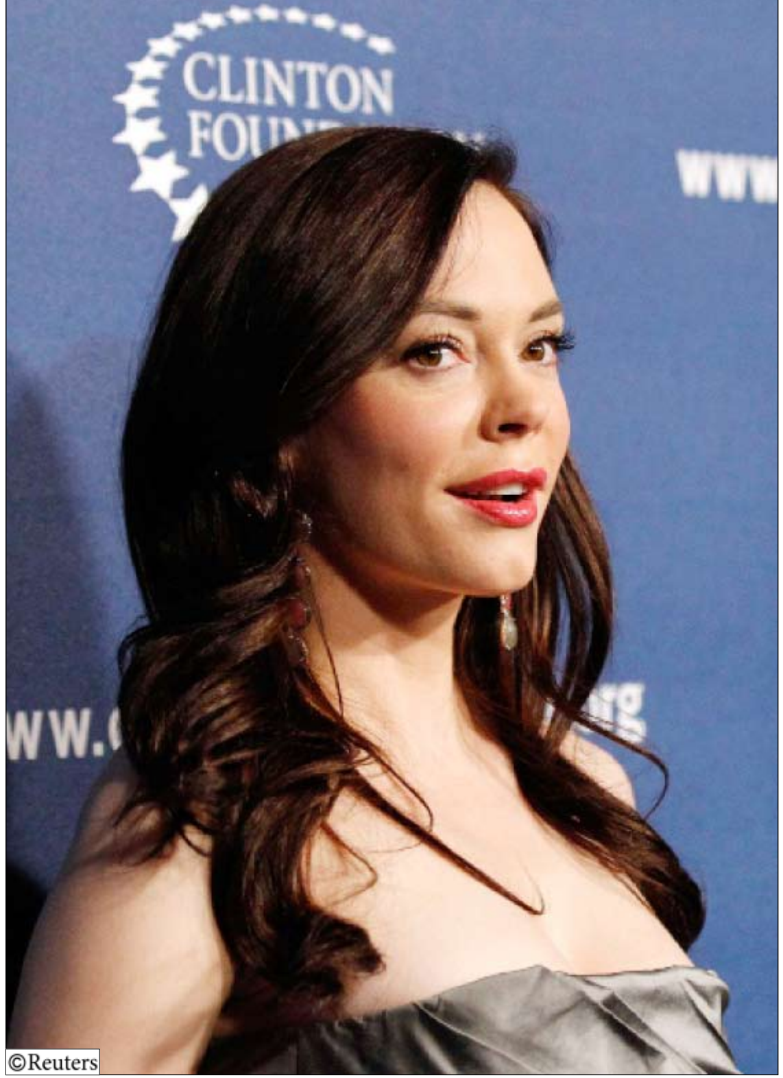
الممثلة روز مكجون لدى حضورها أمس فعالية الشبكة الألفية بلوس أنجلوس التي أطلقت عام في عهد الرئيس الامريكي السابق بيل كلينتون عام 2007م.

وعلياً ان نعرف ايضاً ان ايماننا بالتغيير لا يجب ان نصل اليه عن طريق الفوضى والتخريب واقحام الوطن في اتون الصراع والتلاحن، وبأننا شعب قادر على احداث التغيير من خلال تفاعلاته السياسية التي كفلها الدستور والقانون. وان علينا ان لانقارن انفسنا بما حدث في تونس ومصر واخيراً في ليبيا.. فمقوماتنا وقدراتنا وامكاناتنا ورسيدنا الديمقراطي يجعلنا أعلى من مقارنات كهذه، كوننا كشعب قام مبكراً بمناقشة قضاياها السياسية الاستراتيجية وبصورة مازالت تمثل طموحاً مبكراً لدى اغلبية الشعوب العربية الأخرى.. وأن المستقبل الأفضل لا يمكن ان يتأتى لنا ولا لأجيالنا القادمة إلا من خلال افعال العقل والتعامل الحضاري مع كل التطورات وبروح الديمقراطية المتجددة من المناكفة السياسية والحريصة على تحقيق الاهداف التي تتفق مع عظمة تضحيات شعبنا من أجل تحقيق أماله وتطلعاته المنشودة.