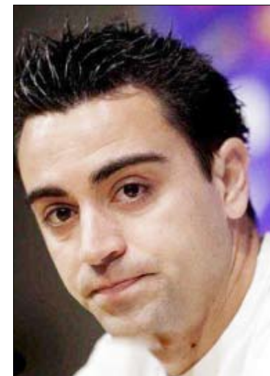
واستبعد تشافي أن تؤثر مثل هذه الادعاءات

بشكل سلبي على مسيرة الفريق الناجحة. وقال تشافي "تسعى للاستمتاع دائماً باللعب وسنواصل عملنا من أجل تحقيق أهدافنا. هناك أناس لا يسعدهم تقدم برشلونة وانتصاراته". وأعرب تشافي عن دهشته من عدم توقيع عقوبات على مثفري مثل هذه الادعاءات والاتهامات الكاذبة. وأوضح تشافي أن مثل هذه الادعاءات تتجاوز الحدود والخطوط الحمراء ولكنها في الوقت نفسه تؤثر بشكل إيجابي كبير على الفريق. وقال تشافي "هذه الادعاءات تمثل حافزاً إضافياً بالنسبة لنا. إنها تحثنا على التآلق والتميز وحصد مزيد من الألقاب. ويتصدر برشلونة جدول مسابقة الدوري الإسباني حالياً بفارق خمس نقاط أمام منافسه التقليدي العنيد ريال مدريد كما يلتقي الفريقان في نهائي كأس ملك إسبانيا منتصف أبريل المقبل. وما زال كل من الفريقين في دائرة المنافسة ببطولة دوري أبطال أوروبا هذا الموسم.