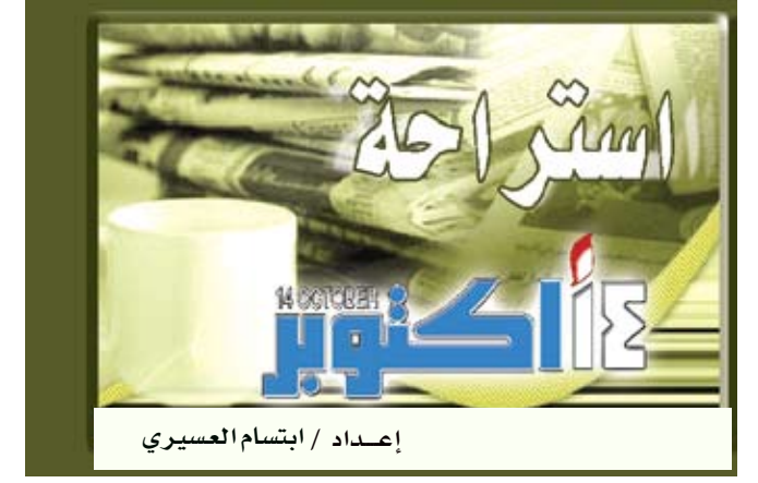
إعداد / ابتسام العسيري

الإصابة بفقدان البصر الناجم عن تضرر جزء تندن / مآبعات : أظهر بحث جديد أن النساء اللواتي يأكلن السمك وأحماض أوميغا 3 الدهنية بشكل دائم ينخفض خطر إصابتهن بأمراض العين المزمنة إلى حد كبير. وذكر كاترين «برس أسوسيشن» البريطانية أن دراسة «صحة المرأة» التي استمرت 10 سنوات وشملت أكثر من 38 ألف امرأة أظهرت أن لتناول الأسماك وأحماض أوميغا 3 الدهنية فائدة في الحماية من الإصابة بفقدان البصر الناجم عن تضرر جزء